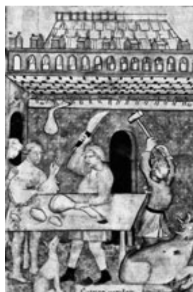
Imágenes con representación de distintos oficios en la Edad Media. Biblioteca Nacional París.