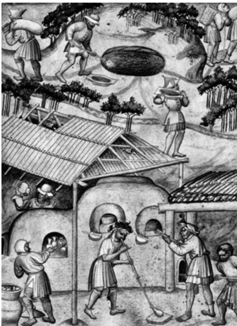
El trabajo del vidrio manuscrito 24189 folio 16. Museo Británico. Londres.

de operaciones y cada una tenía su oficio. En Pisa, los trabajadores del cuero estaban en siete oficios. En París, el artesanado pasa de 130 oficios en 1260 (22 de ellos para el trabajo del hierro) a 300 a fines del siglo XIII. Por el contrario, en las pequeñas aglomeraciones, los operarios se reagrupan en un solo oficio. En Luxemburgo, por ejemplo, todos los artesanos del textil se integran en el oficio de tejedores. Y en Hattingen (Westfalia) una única organización reagrupa a mercaderes, zapateros, tejedores, sastres, carniceros, panaderos y mesoneros.