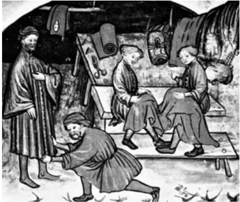
Taller de sastrería. s. XV.

mujeres que trabajaban de manera autónoma. En las profesiones organizadas en oficios, las mujeres se encontraban marginadas, excluidas de la maestría y de las funciones de control y responsabilidad.