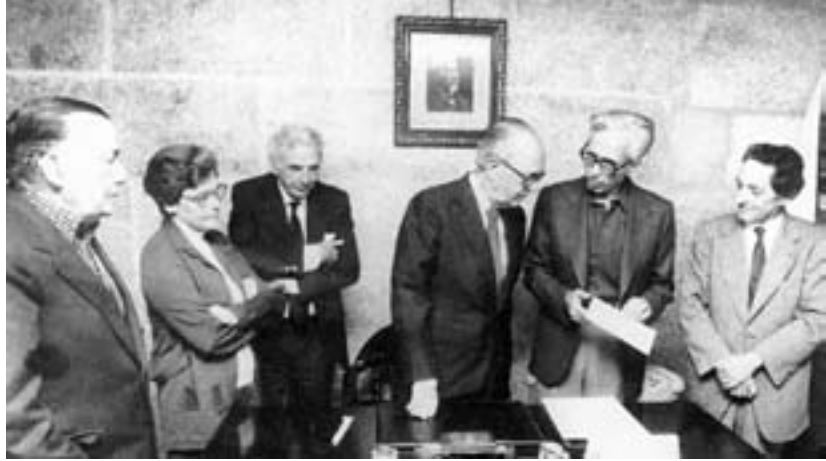
Entrega de documentos traídos de Cuba á Academia Galega. A Coruña 1984.

principal coñecedor e rescatador da memoria galega en Cuba e facilitoulle unha importantísima serie de obras de investigación entre os que sinalamos Galegos no golfo de México (1980), Castelao e Cuba (1983), Rosalía de Castro e Cuba (1993), A lingua galega en Cuba (1995), Galegos que loitaron pola independencia de Cuba (1998), Manuel Murguía e os galegos da Habana (2000), Presenza galega en Cuba (2010) e un longo etcétera.