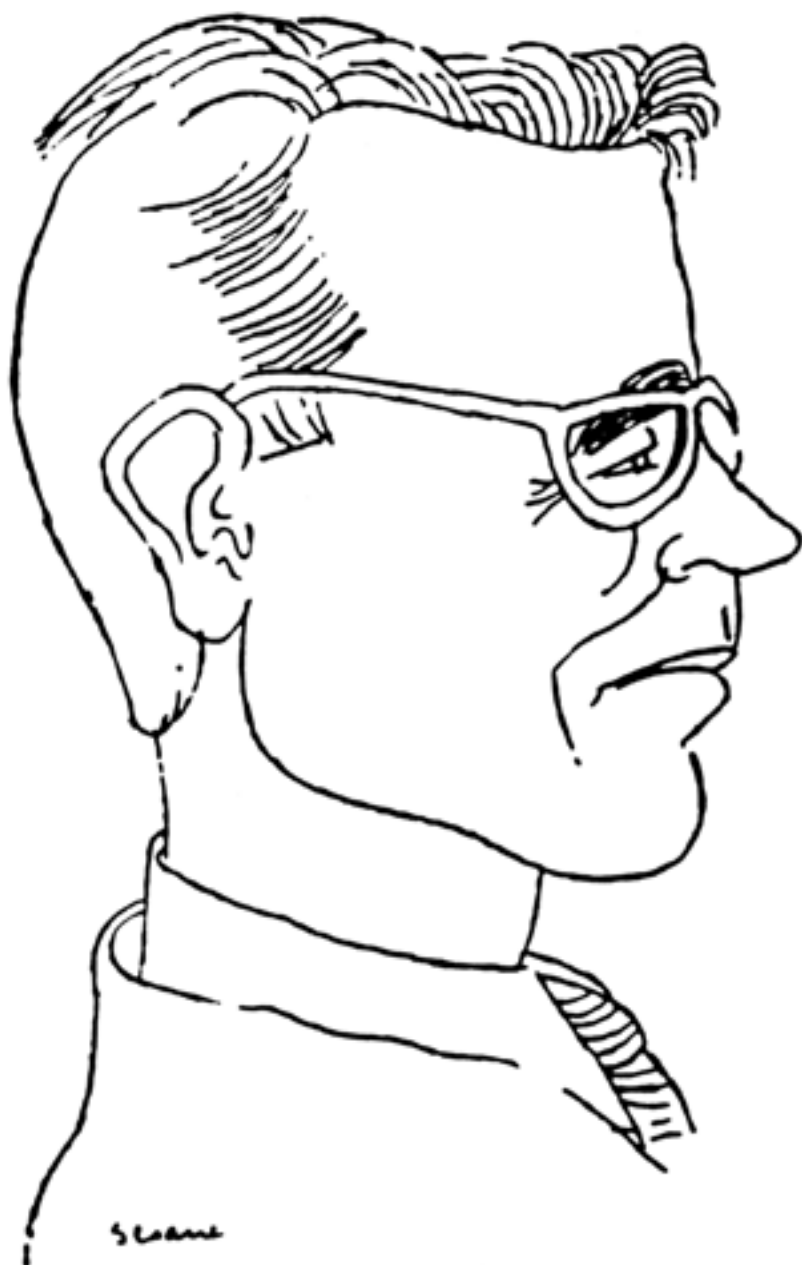
Neira visto por Seoane.