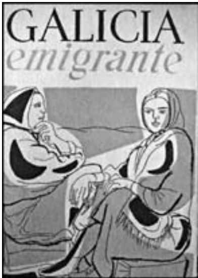
En "Galicia Emigrante" colaboraba Neira Vilas na súa etapa arxentina.

domicilio porteño. Ente eles é de destacar, o grupo Brais Pinto de Madrid, por seren dúas mocidades emigrantes e concienciadas, en contacto.