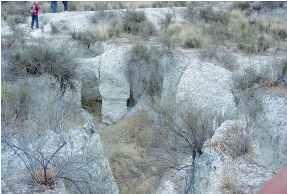
Figura 6. Antiguo campo abandonado en la Cuenca de Mula, donde la elevada densidad de colapsos de la red de drenaje subsuperficial tiende a la construcción de un paisaje de badlands.