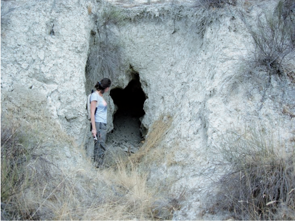
Figura 7. Gran conducto subsuperficial en campo abandonado de la Cuenca de Mula (Murcia), visible por el hundimiento producido en una galería.

tados por sufosión, pues la intensidad de las pérdidas está en relación muy directa con la evolución y magnitud del fenómeno, si bien es cierto que algunos ejemplos de sufosión en la Cuenca de Mula (Murcia) son particularmente espectaculares, tanto por sus dimensiones como por el corto plazo en que se han producido (Fig. 7). Romero-Díaz et al. (2009) apuntan que la profundidad de los hundimientos está muy relacionada con la altura del salto entre bancales (en torno a 2-3 m), aunque se han encontrado colapsos de 7-8 m cuando se han puesto en comunicación directa dos o más bancales. Por esta razón, Romero-Díaz et al. (2007 y 2009) concluyen que, aunque el aterrazamiento contribuye en la mayor parte de los casos a la conservación del suelo en ambientes mediterráneos, en determinadas condiciones puede ser un factor principal de erosión, al aumentar el gradiente hidráulico y favorecer la formación de grandes hundimientos y de cárcavas.