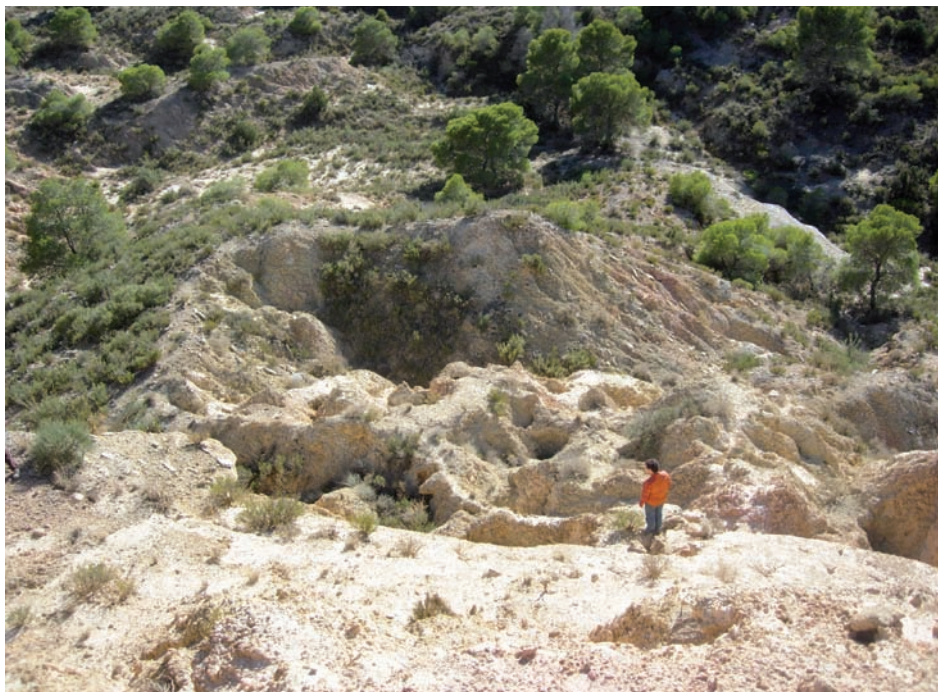
Figura 1. Grandes colapsos en el sector de Jubierre (Monegros, Depresión del Ebro), donde se relacionan con el desarrollo de un paisaje de badlands muy activo.

En Azlor el proceso de formación de pipes es muy activo, con hundimientos de dimensiones hectométricas que son rellenados por los agricultores para frenar su evolución. La mayoría de los colapsos aparece en los bordes de bancales de cultivo, donde el gradiente hidráulico es mayor y, por lo tanto, mayor la energía erosiva de los flujos subsuperficiales. En general, se afirma que el encajamiento de las cárcavas en rellenos de fondo de valle es el factor más importante para facilitar una rápida evolución de los pipes en sus proximidades, al aumentar el gradiente hidráulico (Harvey, 1982; Gutiérrez Elorza et al. , 1988). Ternan et al. (1998) tras estudiar la susceptibilidad al piping en la Formación de Raña entre los ríos Jarama y Sorbe (prov. de Guadalajara), señalan que la incisión de cárcavas proporciona el gradiente hidráulico necesario para el desarrollo de una red de pipes . A partir de ahí la evolución es muy rápida por ampliación de pipes , colapsos y caída de paquetes de sedimento en el borde de la cárcava, hasta generar una morfología caótica. Un proceso muy similar ha sido descrito por Gracia Prieto (1986) en las Bardenas orientales, entre Navarra y Zaragoza), afectando a derrames holocenos, con una alta velocidad de formación.