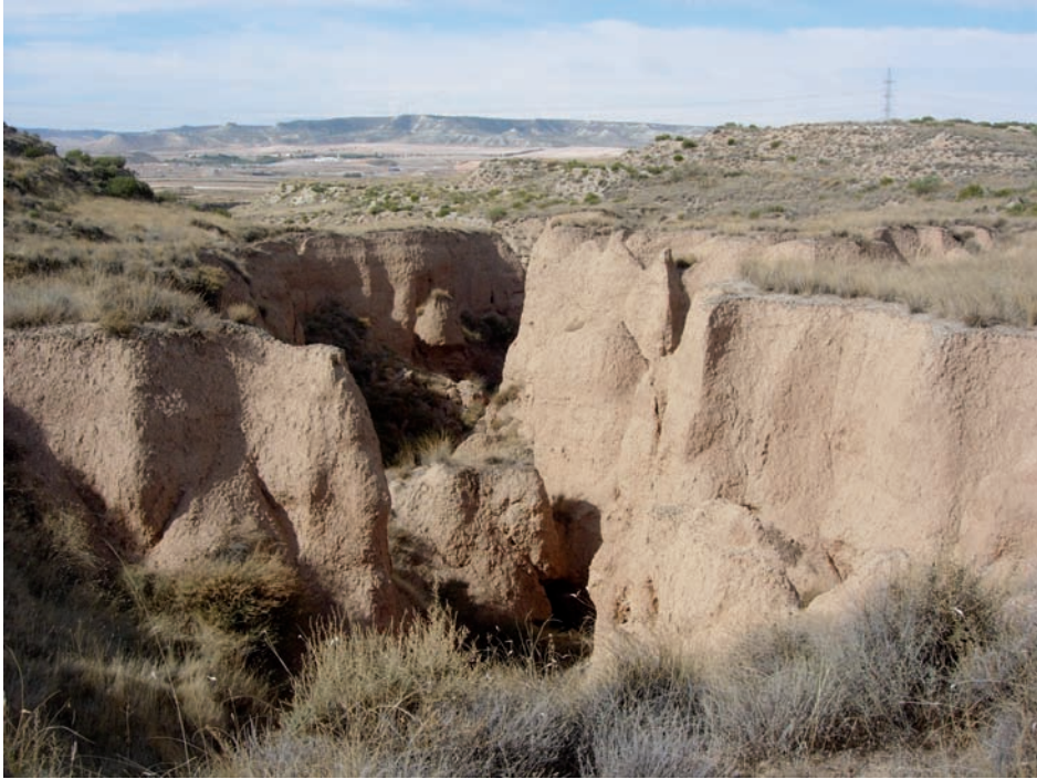
Figura 2. Barranco de Las Lenas, al sur de Zaragoza. La incisión de la cárcava se adapta a los colapsos de la red de drenaje subsuperficial.

concluyen que la densidad de pipes aumenta cerca de las cárcavas y disminuye cerca de los interfluvios. Los pipes controlan la orientación de las cárcavas y estas últimas se desarrollan por colapso de los conductos, hasta el punto de que la forma sinuosa de una cárcava no parece ser resultado de evolución subaérea, sino del colapso de la red de drenaje subsuperficial. En el barranco de las Lenas, Ries & Marzolff (2003) han comprobado que la cabecera de la cárcava principal está rodeada de colapsos y que la propia forma de esa cárcava muestra festones correspondientes a hundimientos relativamente recientes, de manera que gran parte del retroceso de la cabecera se debe a erosión remontante que captura colapsos y hace más rápido ese retroceso (Fig. 2). A su vez, los procesos de sufosión remontan hacia aguas arriba a medida que se ven incentivados por la progresión de la cabecera de la cárcava. La Fig. 3, referida a un pequeño sector en Vera (Almería), muestra la estrecha vinculación entre pipes y cárcavas. La presencia de pipes dentro de las cárcavas sugiere que estas últimas evolucionan en función de los colapsos de la red subsuperficial; por otro lado, la ocurrencia de pipes fuera de las cárcavas indica que la formación de un notable gradiente hidráulico a medida que se va definiendo la cárcava es un factor importante para explicar la generación de nuevos colapsos que más adelante orientarán la evolución remontante de las cárcavas (Calvo-Cases et al. , 1991). En algunos