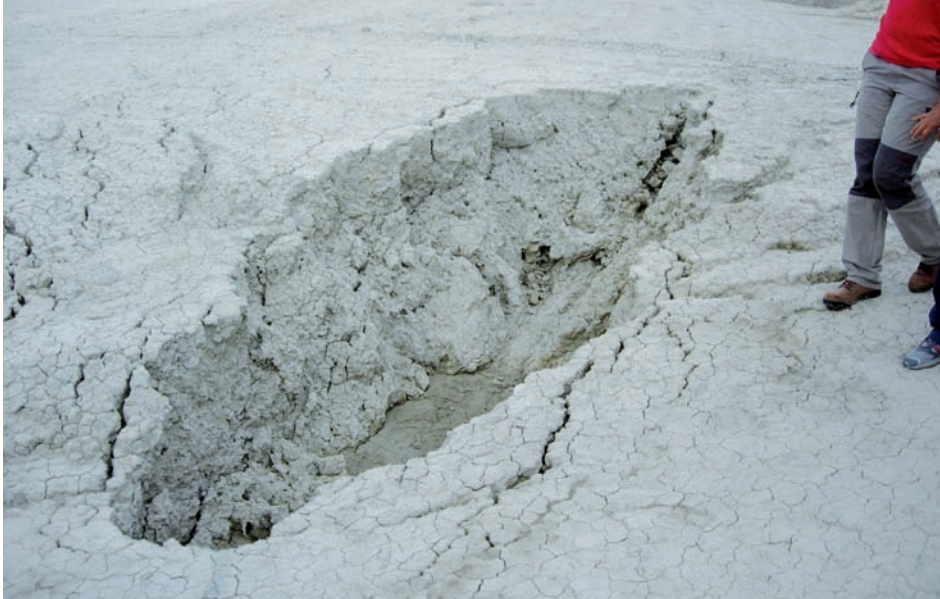
Figura 5. Inicio de colapso en el rellano de un campo abandonado en la cuenca de Mula. Puede deducirse el elevado contenido en margas del suelo.