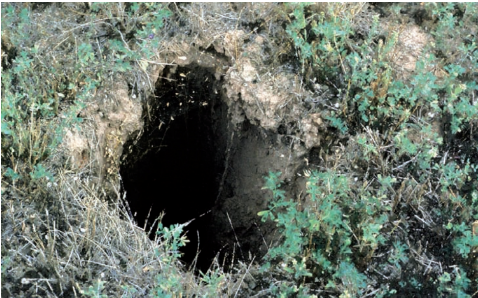
Foto 4. Pequeño conducto vertical (de unos 40 cm de diámetro) en un campo de regadío en Villamediana (La Rioja) con cultivo de alfalfa.