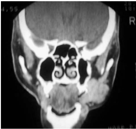
Figura 3. TAC macizo facial (corte coronal), donde se observa el compromiso de la lesión y su infiltrado en tejidos blandos.

- En la angiografía se observa obstrucción del conducto de capilares distales, pertenecientes a ramas del segundo grupo de las colaterales de la arteria maxilar. (Ver Figura 4).