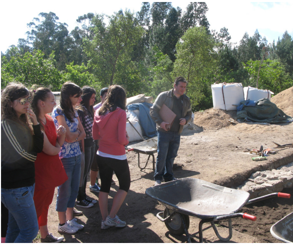
Figura 1. Escolares visitando el Castro de A Lanzada

yecto de los “Parques arqueominerarios de Val di Cornia” (Toscana, Italia).