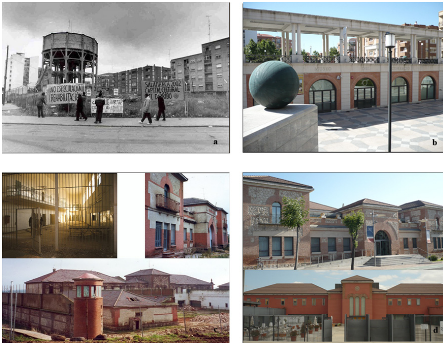
Figura 2. a) Depósito de aguas de Campoamor ; b) Museo del Comercio ; c) Antigua Prisión Provincial de Salamanca ; d) DA2.

Ahora bien, la producción de este conocimiento histórico no debería ser sólo fruto de la labor de un equipo de historiadores, sino que sería preciso llevar a cabo un esfuerzo de diálogo constante con la sociedad local. La recopilación de fuentes no debería tan sólo consistir en una visita a los archivos, sino en un trabajo de recuperación de la historia oral de la ciudad, de manera que los propios ciudadanos puedan tanto rememorar su ciudad como manifestar sus preocupaciones actuales en relación con el espacio en el que viven. Un conocimiento histórico más cercano a la sociedad local podría así integrarse como parte de la acción social ciudadana: por un lado, en fundamentación de la protesta ante la desatención; y, por otro, como herramienta crítica frente a los discursos que pretenden imponerse sobre el espacio. Queremos, en este último apartado, exponer de manera sucinta la idea para un proyecto que buscaría abordar todos estos aspectos a través de un equipo multidisciplinar de historiadores, historiadores del arte, arqueólogos, geógrafos, an-