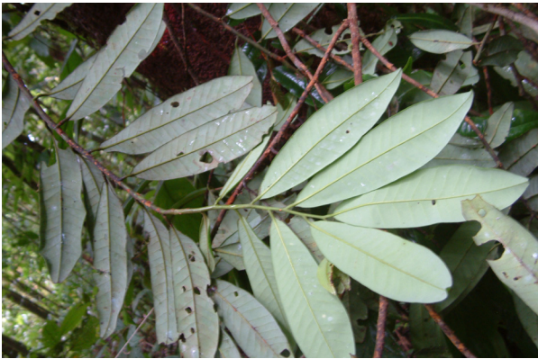
Figura 3. Virola pavonis (A. DC.) A.C. Sm. Foto de tipo colección (Foto y colecta: Monteagudo, 14453. Jardín Botánico de Missouri, 2007)