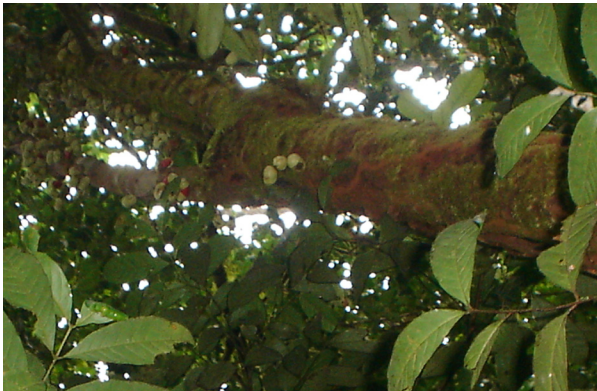
Figura 4. Infrutescencia caulógena Iryanthera juruensis Warb. Parcela Paujil 410 msnm. Árbol # 564.

Árboles medianos de hasta 20 m. Hojas elíptico-oblongas, de 37-40 x 8-11 cm, ápice acuminado, base cordada, indumento evidente en el envés con una diversidad de tricomas, salpicado de puntuaciones ferruginosas; pecíolos de 7-15 mm de largo.