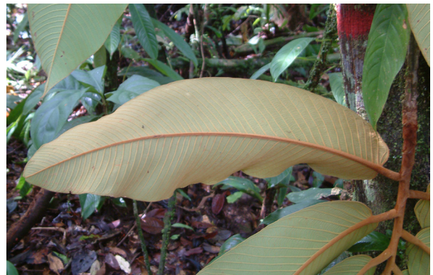
Figura 2. Virola multinervia Ducke. Foto de tipo colección (Foto y colecta: Monteagudo, 14421. Jardín Botánico de Missouri, 2007)

broquidódroma y venación secundaria unida, distante a margen de la hoja. En el departamento de Pasco se encuentran registrados hasta el momento seis especies de las cuales Iryanthera elliptica Ducke, no será descrita ya que no fue determinada en esta revisión. Entre las más frecuentes tenemos a I. juruensis e I. paraensis las cuales se distribuyen desde los 150 a los 1.100 msnm dentro del departamento, se diferencian por la inflorescencia caulógena muy evidente de I. juruensis (Figura 2). De igual modo sucede con I. laevis e I. ulei , ambas con características comunes excepto por la lenticelas de I. laevis , y el tamaño de I. ulei siendo esta especie poco común en nuestro país, reportada comúnmente entre la frontera con Brasil en donde es ampliamente diseminada (Ribeiro et al., 1999). Con respecto a I. macrophylla es uno de los representantes con las hojas más grandes dentro de este grupo, distribuida desde los 0 a 500 msnm (Brako y Zarucchi, 1993)