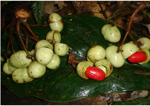
Figura 5. Frutos capsulares Iryanthera juruensis Warb. Parcela Paujil 410 msnm. Árbol # 564.