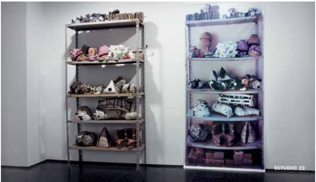
Estado de cosas