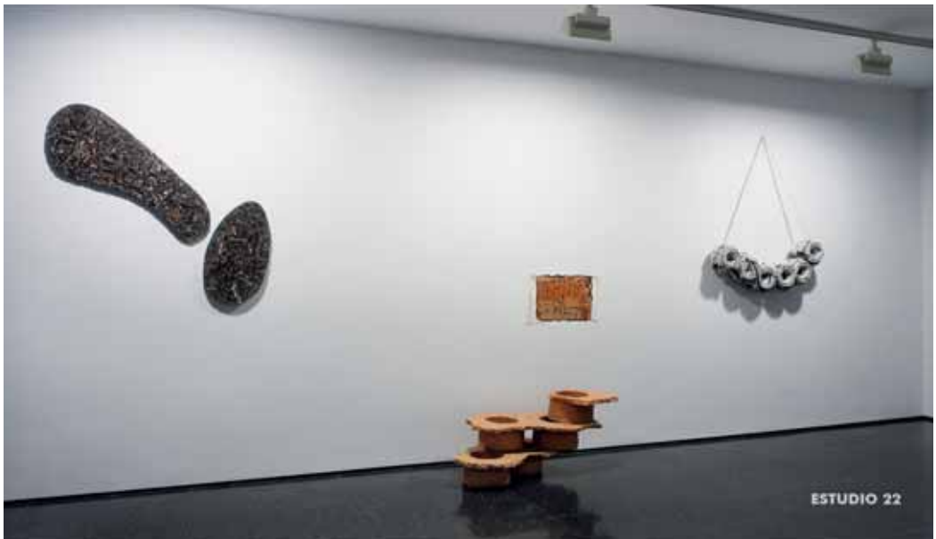
Estado de cosas