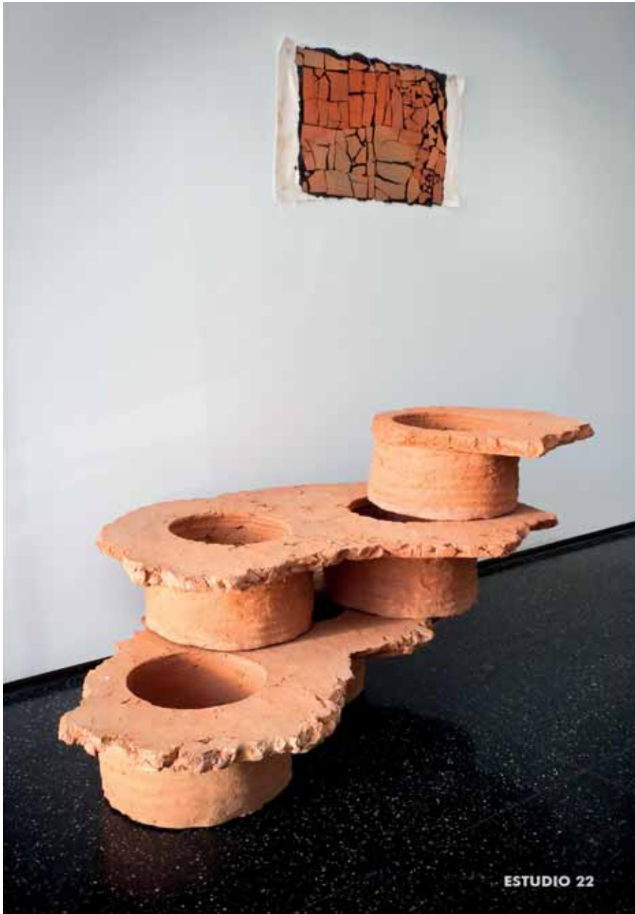
Estado de cosas