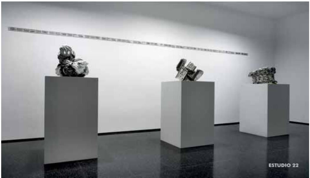
Momentos de tierra