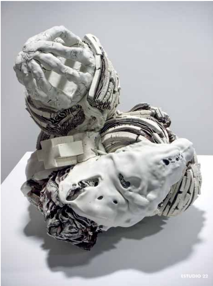
Momentos de tierra