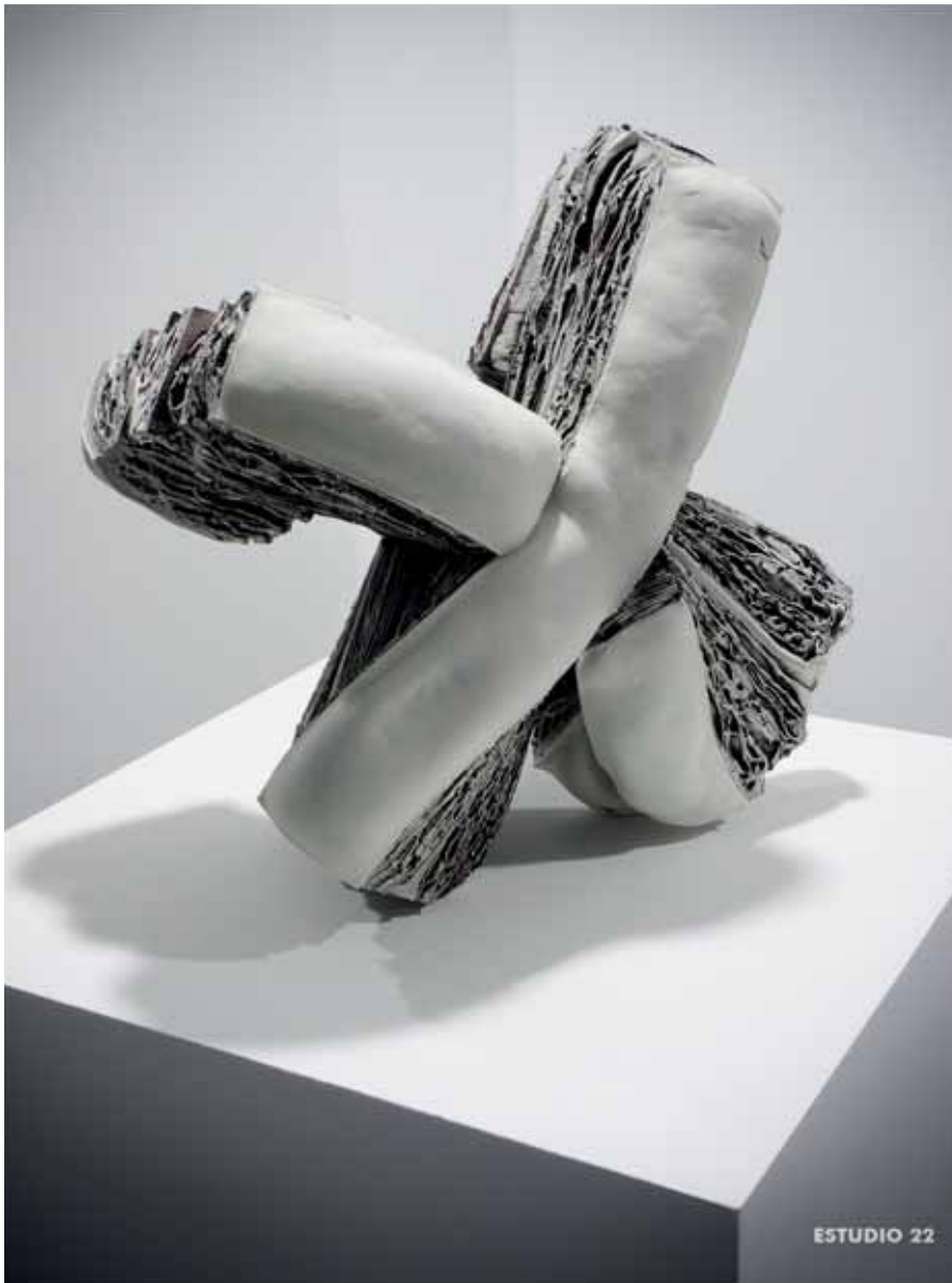
Momentos de tierra