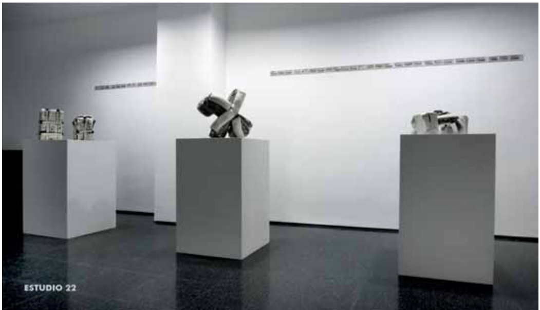
Momentos de tierra