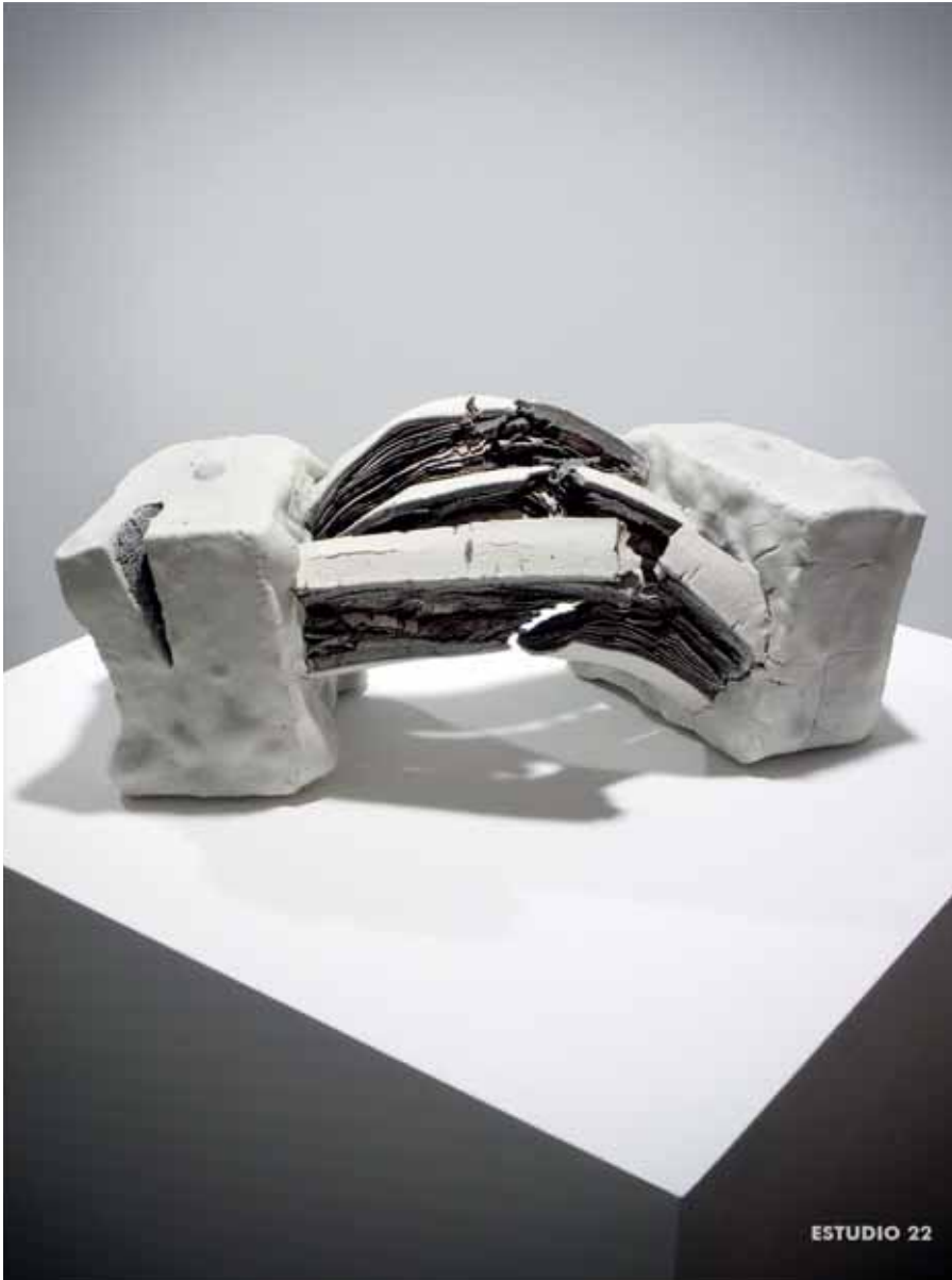
Momentos de tierra