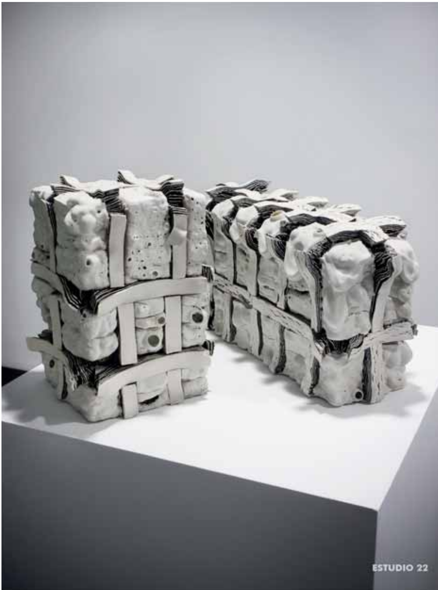
Momentos de tierra