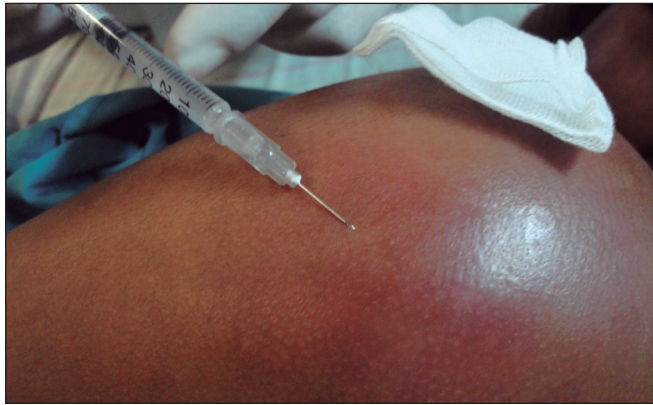
Figura 1. Toma de la muestra, técnica PIA

titud en comparación a un hemocultivo, sobre todo debido a que este último es usado como marcador diagnóstico de agente etiológico en nuestro Hospital.