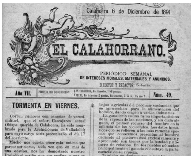
Lám. 2. El Calahorrano nº 49 de 6 de diciembre de 1891.

subida de aranceles y el incremento de la presión fiscal decretada por el gobierno conservador. El impuesto de consumos que gravaba artículos básicos de la dieta como el pan, enfrentaría a ciudadanos y concejos. Como señala Gil Andrés “el odiado impuesto de consumos será el blanco de las iras populares, concentrándose los motines en el verano, cuando normalmente se renuevan los arriendos al comenzar el año económico” 39 . Por tanto podemos decir que “en La Rioja, el siglo se despedía lleno de hambres y de desastres políticos nacionales” 40 . Esta consideración, aunque breve, es suficiente para situarnos en un contexto social y económico muy desfavorable para la población, un terreno abonado para el incremento de las revueltas que expresarían un descontento en el que influían ya de manera notable el ascenso de las ideologías socialistas y anarquistas que recorrían la península de punta a cabo. A mi entender, este descontento social, será elemento inseparable de la crisis política provocada por el intento de trasladar la silla episcopal.