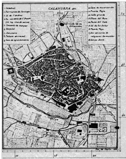
Lám. 1. Calahorra 1851. Mapa de Coello.

En el caso de la diócesis de Calahorra y La Calzada el Concordato suscrito repercutía en varios aspectos de su organización interna. En primer lugar, se creaba una nueva diócesis, la de Vitoria, que agruparía a todas las provincias vascas y que sería segregada de su diócesis matriz. El otro aspecto no menos importante era la disposición que resolvía la traslación de la Silla episcopal de Calahorra a la capital provincial, Logroño. Ambas instrucciones se encuentran recogidas en el artículo 5 del citado texto legal y será la persistencia en su aplicación la que generará enormes tensiones entre la capital político-administrativa, Logroño y la capital diocesana, Calahorra 4 .