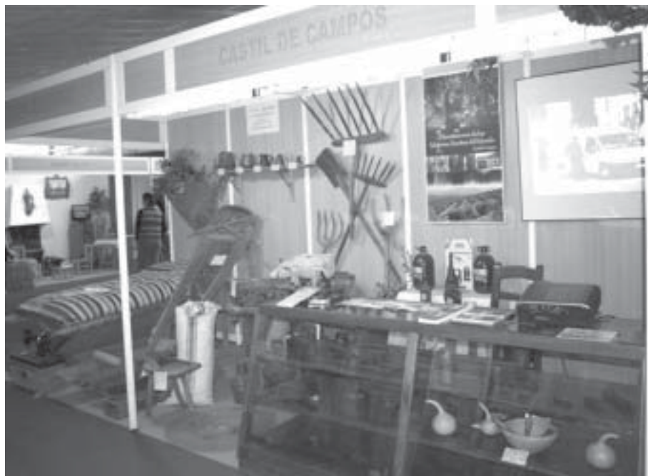
Lám. 6. Expositor montado en diciembre de 2009 por la Entidad Local Autónoma de Castil de Campos, con motivo de la V Feria de Municipios de Córdoba, con piezas de la Casa-Museo de Artes y Costumbres populares de Castil de Campos

llo Económico y Planificación Estratégica de la Excm. Diputación Provincial de Córdoba. (Lám. 6)