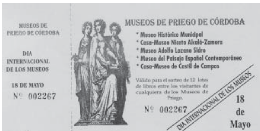
Lám. 7. Ejemplar de entrada gratuita, para los museos de Priego, con la que se participa en el sorteo de varios lotes de libros, con motivo del Día Internacional de los Museos

Para la difusión de la Casa-Museo, y del pueblo de Castil de Campos en general, se dispone de una página web, alojada de forma gratuita en un servidor, y mantenida y actualizada periódicamente, también de forma gratuita, por el Presidente de la Asociación Cultural, que cuenta con numerosas y variadas secciones: localización, historia, naturaleza, costum-