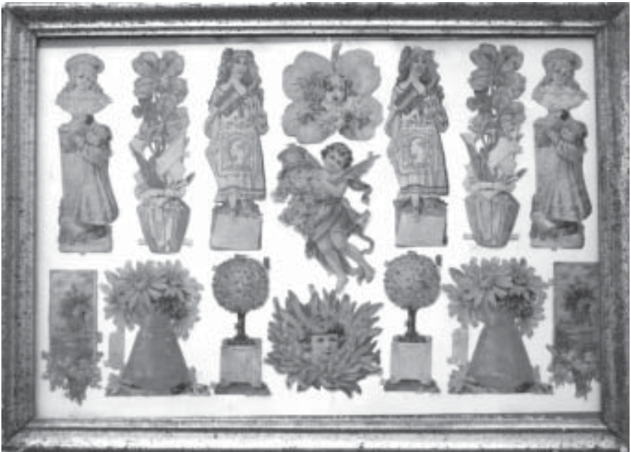
Lám. 4. Cuadro con cromos de los chocolates de la Casa Juncosa de Barcelona, tras su restauración