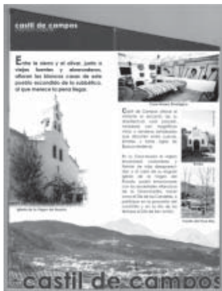
Lám. 1. Folleto divulgativo y turístico editado por el proyecto "Turismo y Aceite" con la colaboración de la Asociación Cultural de Castil de Campos, en el que se muestra la información correspondiente a Castil de Campos