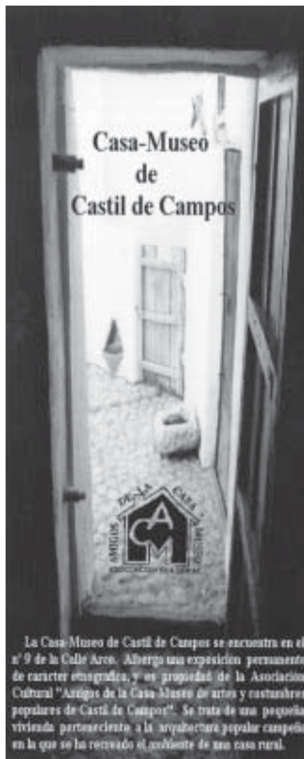
Lám. 3. Portada del tríptico divulgativo y turístico editado en 2007 por la Asociación Cultural

Otras subvenciones recibidas por la Asociación Cultural de Castil de Campos han sido: 200 € el 21 de febrero de 2007, por el Consejo Regulador de la Denominación de Origen de Priego, para la elaboración de un tríptico con información básica de la