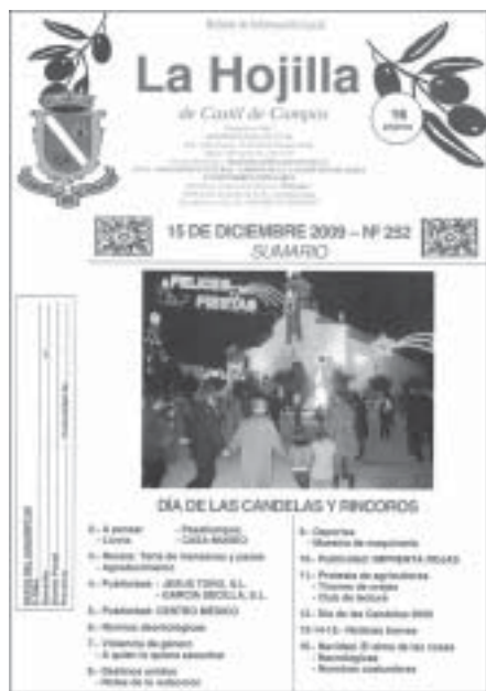
Lám. 8. Portada del último número de 2009, de La Hojilla de Castil de Campos, boletín de información local editado por la Asociación Cultural "Amigos de la Casa-Museo de Artes y Costumbres Populares de Castil de Campos", con periodicidad mensual

bres y tradiciones, callejero, senderismo, casa-museo.... La dirección de esta página web es www.castildecampos.webcindario.com y la dirección de correo electrónico webdecastildecampos@gmail.com .