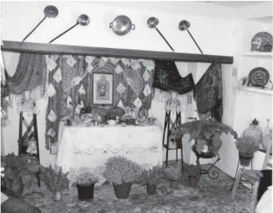
Lám. 5. Altar montado en el salón de la Casa-Museo durante agosto de 2004, para recuperar la costumbre del Santo Rostro en Castil de Campos

La Casa-Museo de Castil de Campos ha prestado distintas piezas para decorar el expositor que el Ayuntamiento de la Entidad Local Autónoma de Castil de Campos, monta con motivo de las distintas Ferias de los Municipios de Córdoba que anualmente se organizan en el Palacio de la Merced o en IFECO (recinto ferial de Córdoba), por la Delegación de Desarrollo