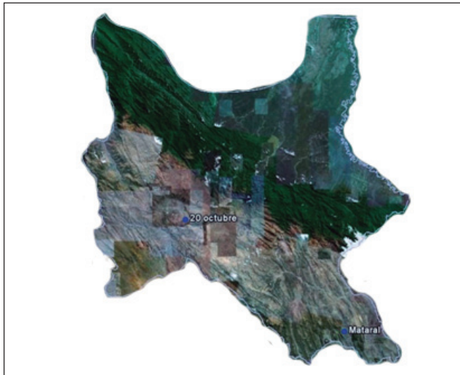
Figura 1. Ubicación bio-geográfica de las cepas silvestres de T. infestans en Valles (20 de Octubre), Chaco Serrano (Mataral), del Departamento de Cochabamba.

bio-geográfica de los Valles Mesotérmicos Andinos y en menor grado en el Chaco Boreal de Bolivia. Consecuentemente se ha demostrado la amenaza que pueden representar estas poblaciones silvestres, en el proceso de re-infestación de viviendas en zonas endémicas, la capacidad de mantener el ciclo natural de la enfermedad, es decir que su condición de hematófago le permite transmitir el parásito Trypanosoma cruzi (agente etiológico de la enfermedad de Chagas) a sus hospederos vertebrados 14-18 .