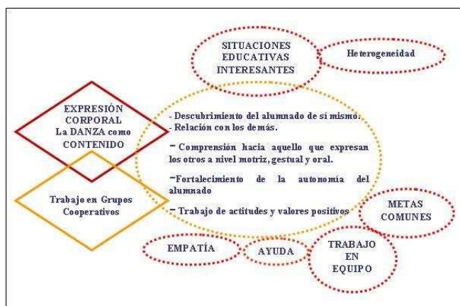
Figura 2. Situaciones educativas interesantes.

Asimismo, hay que resaltar la importancia de que los grupos cooperativos sean heterogéneos, en relación al sexo, competencia motriz, capacidades comunicativas y relaciones amistosas, ya que permiten situaciones educativas más interesantes para todos sus miembros.