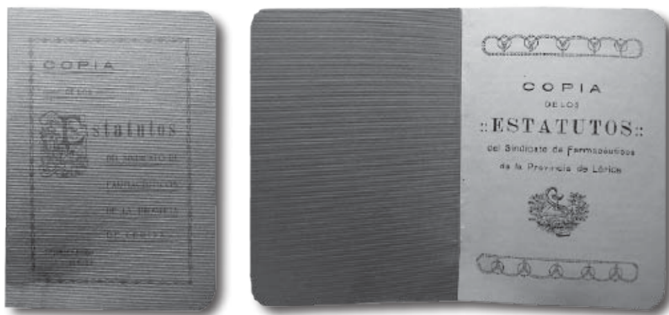
Fig. 1 i 2.- Còpia dels Estatuts del Sindicat de Farmacèutics de la Província de Lleida.

Aquest projecte d'estatuts publicat al Butlletí número 25 té la mateixa redacció que una còpia que s'ha localitzat a l'arxiu familiar dels hereus d'Enric Solé, de Tremp.