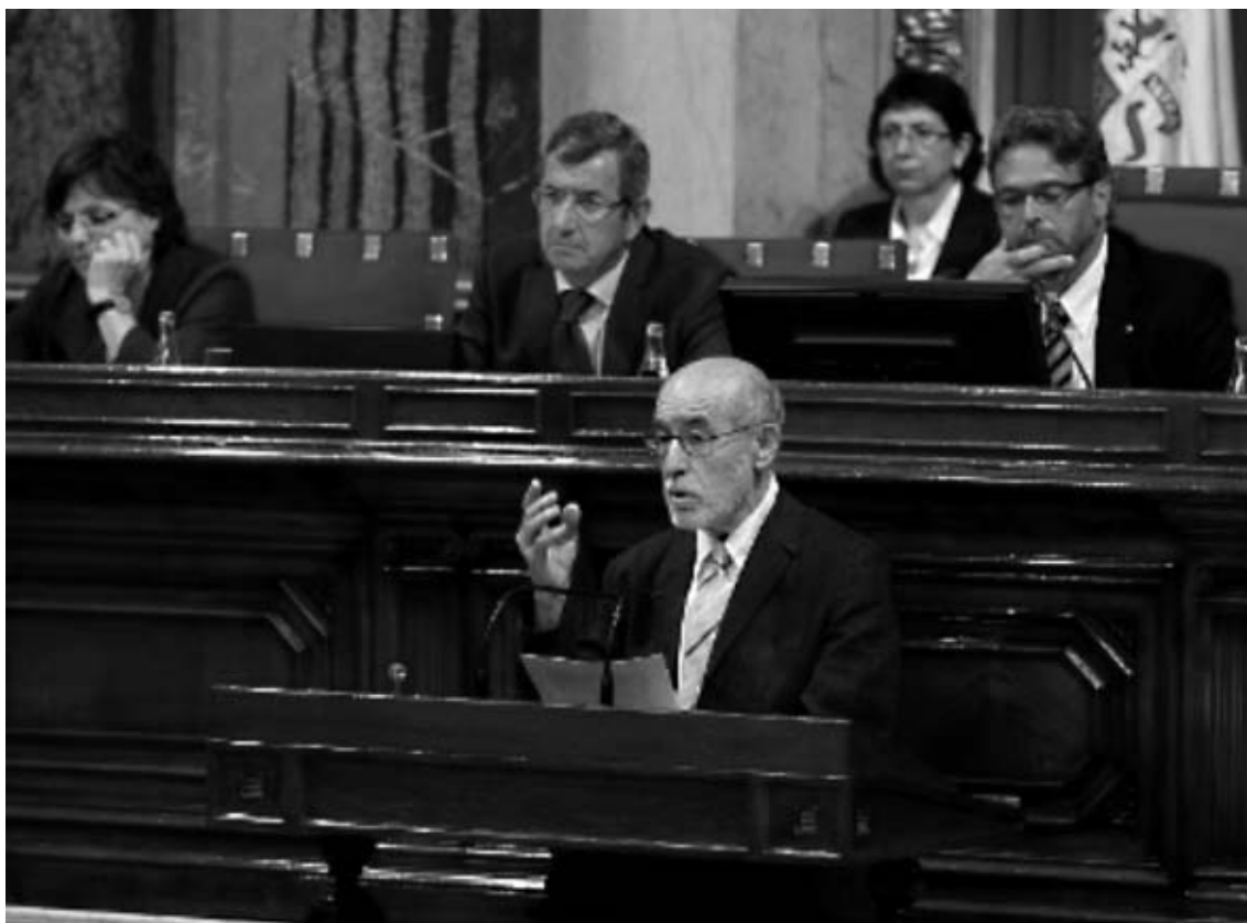
Parlament de Catalunya, l'1 de juliol del 2009.