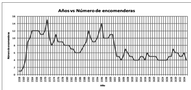
GRÁFICO 3: FRECUENCIA DEL NÚMERO DE ENCOMENDERAS

Fuente: Datos elaborados por el autor con base en bibliografía secundaria y fuentes de Archivo 73