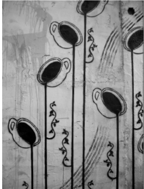
Plantillas de CESP, Respeto Total y algo de ONLY, (XLF), 2006.

efímero; su vinculación y apropiación de técnicas publicitarias y de expresión revulsiva para algunos vecinos; el deseo de comunicarse y autoafirmarse por parte de estos artistas vándalos, mediante el color y la pintura en las paredes. Pero ante todo fascina su deriva, su evolución hacia ese terreno de frontera, difuso y en continua redefinición, que en las publicaciones anglosajonas sobre graffiti llaman urban art , al considerar superados los métodos de la vieja escuela neoyorquina y abrazar la era posgraffiti. Situación que puede contemplarse este año, a poco que pasees mirando las paredes, 10 por el Barrio del Carmen de la ciudad de Valencia, donde las campañas de represión y limpieza de cientos de tags y potas 11 intentando dejarse ver, no impiden disfrutar de plantillas, adhesivos, papeles pegados con dibujos, hojas de poesía y periódicos pintados, y cada vez más tiendas con ropas, muñecos 12 y juguetes asociados a esta subcultura urbana.