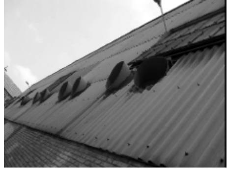
Barrio de Malilla, Valencia.