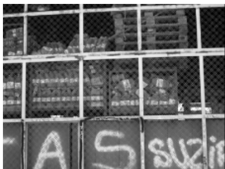
Barrio de Malilla, Valencia.