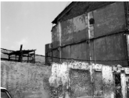
Barrio de Malilla, Valencia.