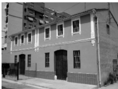
Barrio de Malilla, Valencia.