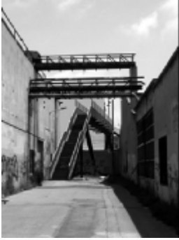
Barrio de Malilla, Valencia.