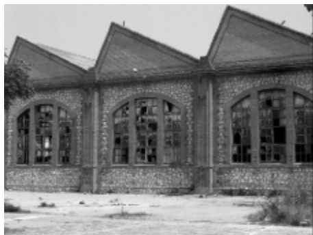
Barrio de Malilla, Valencia.