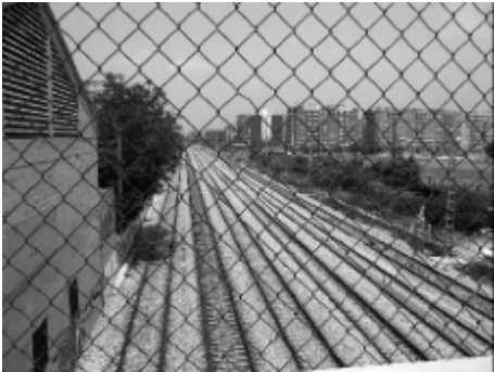
Barrio de Malilla, Valencia.