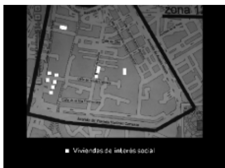
Viviendas de interés social