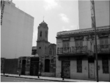
Barrio de Malilla, Valencia.