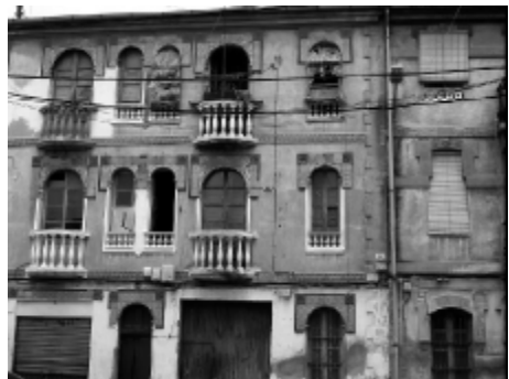
Barrio de Malilla, Valencia.