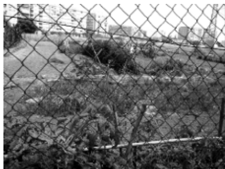
Barrio de Malilla, Valencia.