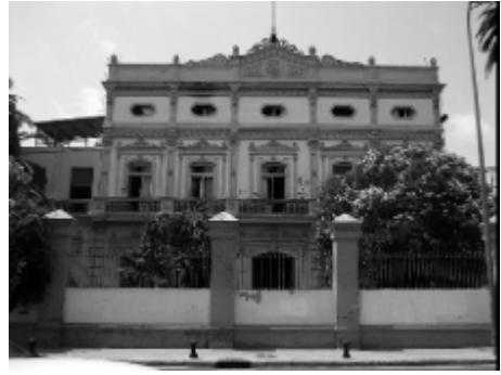
Barrio de Malilla, Valencia.