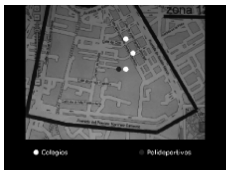
Colegios y polideportivos