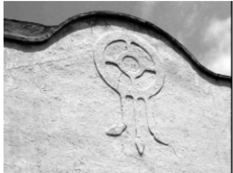
Barrio de Malilla, Valencia.