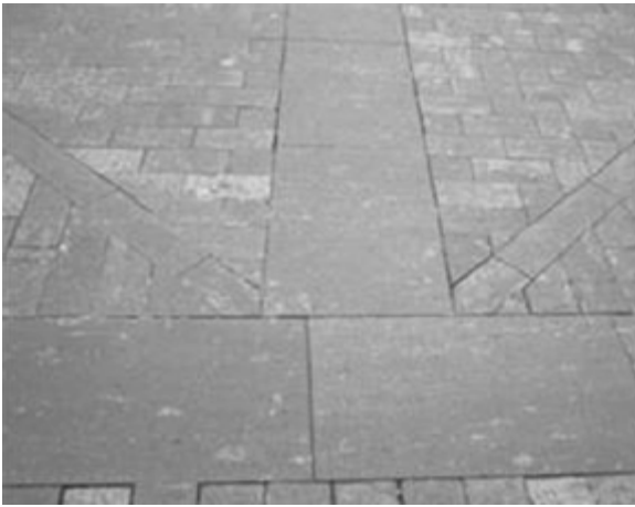
Otros efectos de la actividad comercial globalizada.