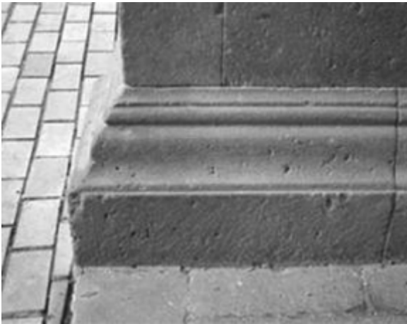
Actuaciones de restauración recientes. Cabrera Pinto.