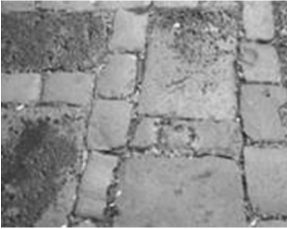
Actuaciones de restauración recientes. Cabrera Pinto.