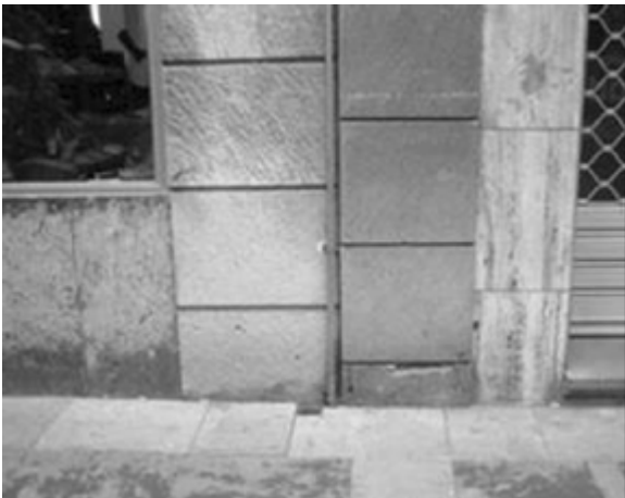
Otros efectos de la actividad comercial globalizada.