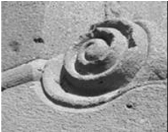
Detalles de rocas y tipos de labra habituales en edificios históricos Laguneros