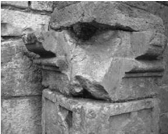
Otras actuaciones no tan afortunadas.