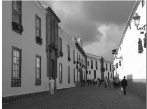
Una calle de San Cristóbal de la Laguna.

usan en las fachadas predominantemente rocas duras, basalto e ignimbritas de color gris azulado oscuro como las que hoy que se siguen extrayendo en las canteras del sur de la isla, en tanto que la primera época había dado mayor acogida a piedras más blandas, de tonos ocres y rojizos provenientes de canteras cercanas.