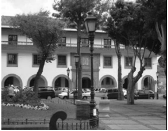
Edificio del juzgado, s. XX.