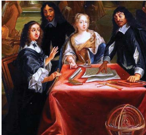
PIERRE-LOUIS THE YOUNGER DUMESNIL. CHRISTINA DE SUECIA Y SU CORTE, DETALLE DE LA REINA Y RENÉ DESCARTES

Profesora titular de la Facultad de Filosofía de la Universidad de Sevilla