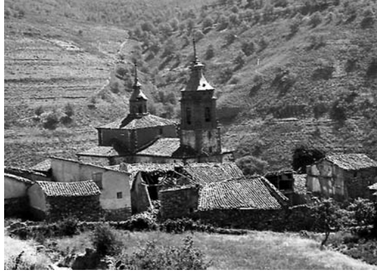
Fig. 1. Iglesia de San Martín de Treguajantes en la década de los años setenta del siglo XX.