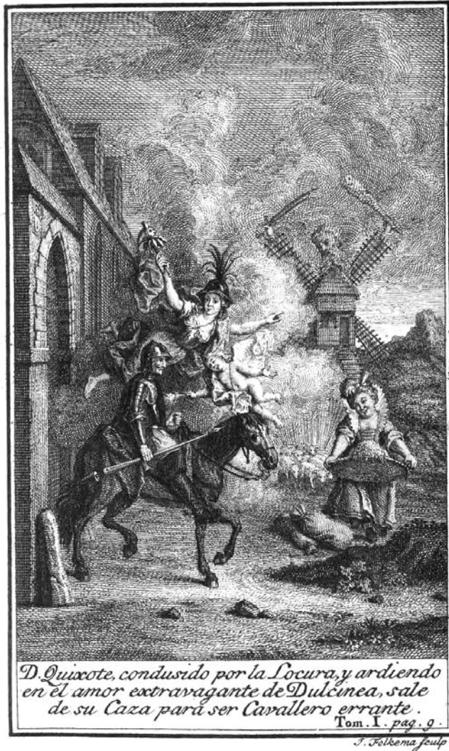
Fig. 4. Coypel/Folkema. Ilustración de la Vida del Ingenioso..., editada en español en 1744 en La Haya por P. Gosse y A. Moetjens. Las ilustraciones de Coypel se editaron en folio mayor.

cional, veintitrés volúmenes que suponen un poco más de un 8%. Entre los que estaban escritos en español se encuentran éstos. Además en esta misma lengua conservaba algún libro de historia y las obras de Lope de Vega, así como una edición en folio mayor de El Quijote con grabados, posiblemente la ilustrada por Coypel 23 .