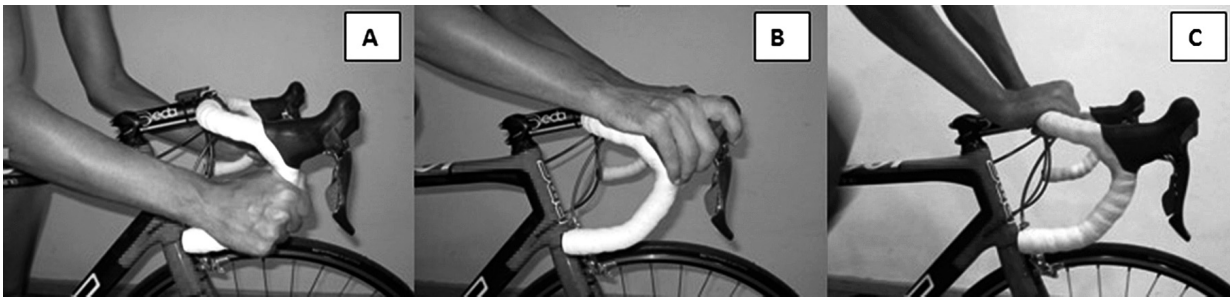
Figura 1. Posiciones sobre el manillar: agarre bajo; agarre de manetas; agarre transversal.