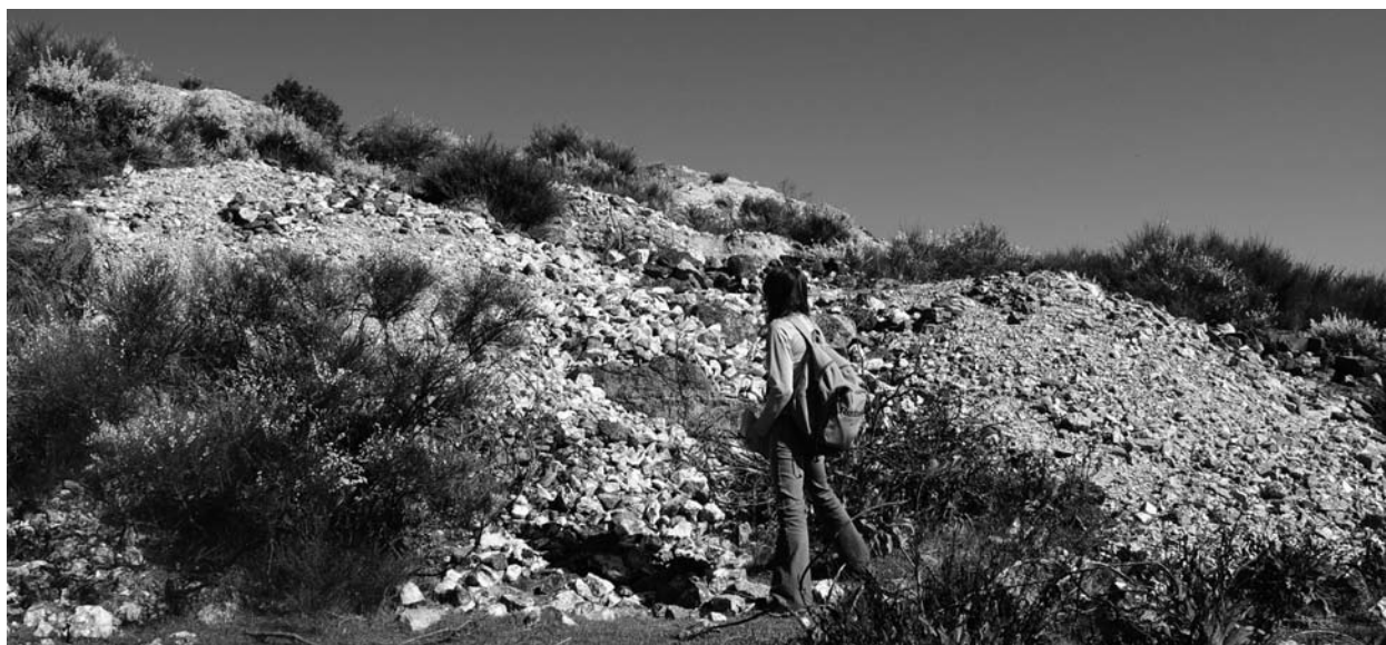
Figura 4. Escombreras de la mina Santa María, en el sector W del Cerro de San Cristóbal.