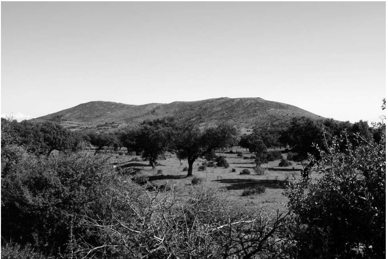
Figura 1. Vista desde el Norte del Cerro de San Cristóbal.