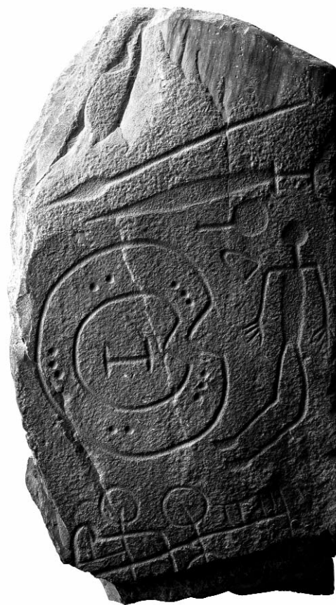
Figura 3. Estela de Solana de Cabañas.

Una de las principales secuelas de la Guerra Civil Española (1936-1939) fue la limitación en la importación