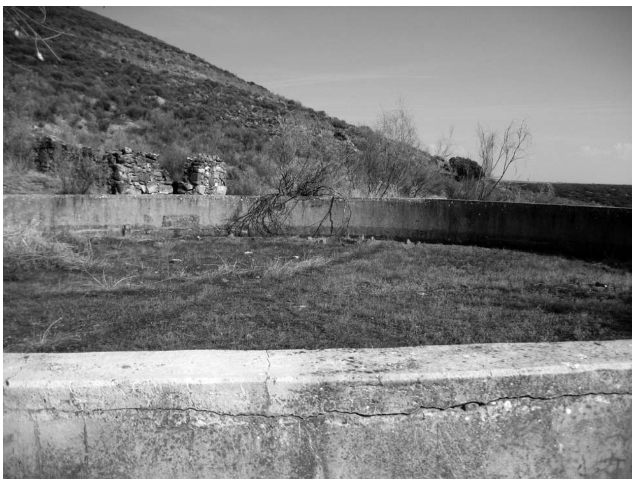
Figura 5. Balsa de decantación al sur del Cerro de San Cristóbal.