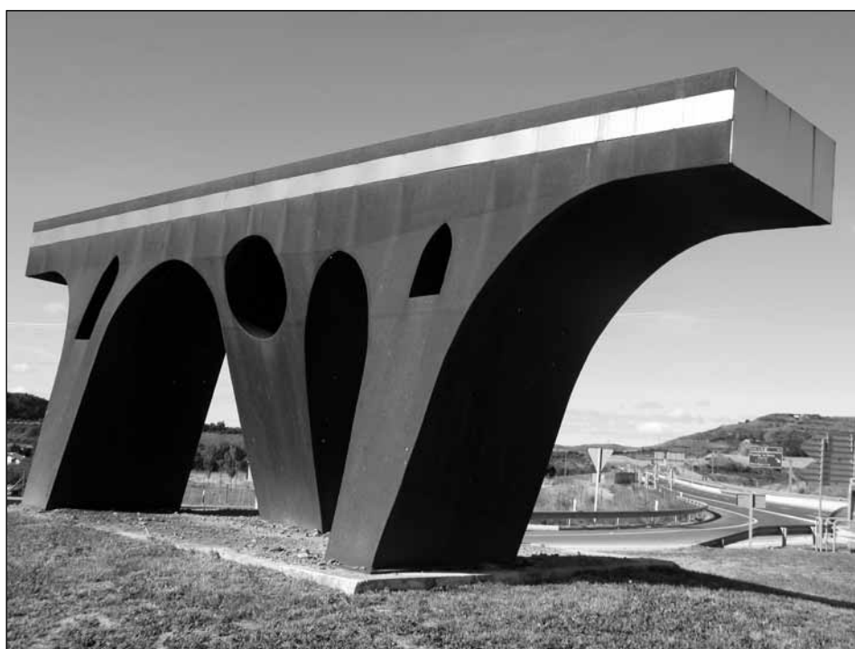
Figura 3. Carlos Ciriza. “Puente paso de Europa”.

glo XI que atraviesa el río Arga y da nombre a la localidad, el cual constituye uno de los más bellos ejemplares de época medieval conservados en Navarra y el más importante de cuantos se cruzan a lo largo del Camino de Santiago. Pero a su vez, el puente de Ciriza adquiere también un significado más profundo al convertirse en símbolo de la comunicación entre personas y de la unión entre pueblos y culturas que representa el Camino de Santiago. Por tal motivo, también los materiales adquieren en esta ocasión un significado concreto, pues así como el acero cortén hace referencia precisa a la tierra, a lo mudable y también a lo originario, el acero inoxidable que mantiene su color gris inalterable nos acerca más a la realidad universal de la ruta jacobea como punto de encuentro 21 . Ciriza acierta a combinar el carácter rotundo de los volúmenes con la apertura de huecos y el diferente tratamiento de los pilares que otorga cierta flexibilidad al conjunto para lograr, a partir de su fuente de inspiración, una obra con personalidad propia en su aparente sencillez.