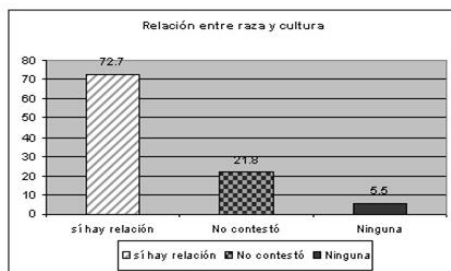
Gráfica 3. ¿Existe relación entre raza y cultura?

En esta pregunta iba implícita la idea de observar si los profesionales de la educación distinguían entre aspectos biológicos y culturales. El 5.5 por ciento señaló que no existe relación, mientras el 21.8 por ciento no contestó la pregunta; el 72.7 por ciento restante sí consideró que existe relación (ver la gráfica 3).