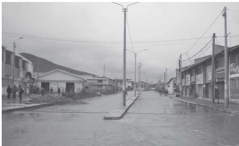
Fotografía 4 Avenida en la ciudad nueva

En efecto, las amplias calles de la ciudad nueva resultaron poco amigables para el cerreño transeúnte, pues queda expuesto al frío viento vespertino de la región, sin ningún elemento urbano que lo proteja (fotografía 4). Del mismo modo, las modernas construcciones de concreto armado resultaron poco eficientes para abrigar a la población por sus pobres propiedades térmicas en comparación al adobe. La presencia de un trazo urbano moderno no supuso entonces una necesaria mejora de la calidad de vida, pues no definió adecuadamente su inserción a este particular medio físico.