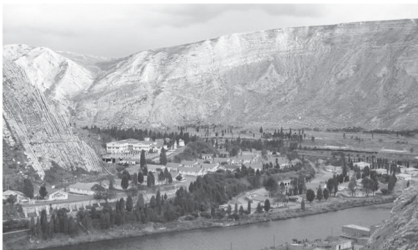
Fotografía 2 Barrio de Chulec en La Oroya