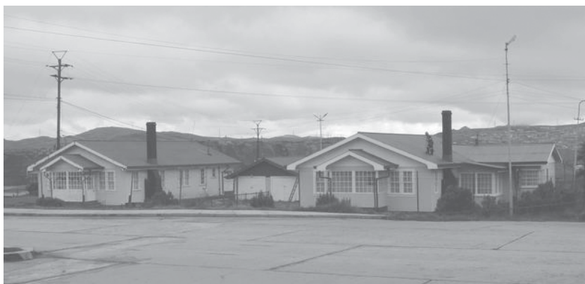
Fotografía 3 Residencias para ingenieros en Cerro de Pasco

La organización espacial de Cerro de Pasco guarda semejanzas con la de La Oroya, a pesar de que en ese caso sí existía una ciudad antes de la intervención de la empresa minera transnacional. Por ejemplo, en Cerro de Pasco también se definió un espacio independiente como zona residencial para ingenieros (ver la fotografía 3), donde se incluyeron equipamientos especiales, como un campo de golf y un casino.