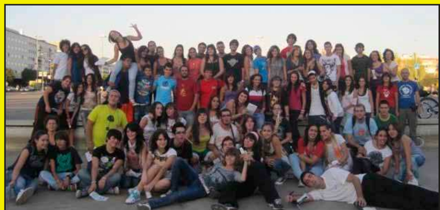
Asamblea de Inicio 2010-2011.