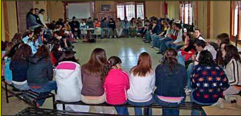
Asamblea Encuentro de Navidad.

en la toma de decisiones, como en la relación entre las personas que participan del mismo.