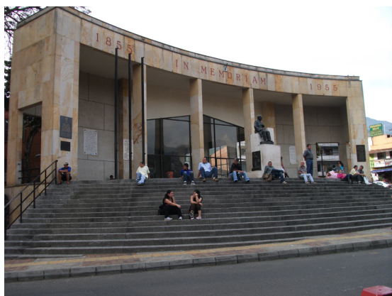
Tomado de Jose Fernando Valencia

----- (2005). Facticidad y Validez. Sobre el Derecho y el Estado Democrático de Derecho en Términos de Teoría del Discurso . Madrid: Trotta. Vox populi politecnico jic. En: http://www.youtube.com/watch?v=2o8XjVkBByoc&feature=player_embedded Protesta en el politécnico jaimé isaza cadauid 1 en: http://www.youtube.com/