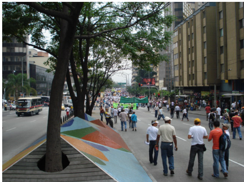
Tomado de Jose Fernando Valencia

en la ciudad, un debate sobre la pobreza, la exclusión y la situación de los sectores populares desde la definición de una problemática que se empezó a proyectar desde el 2004 en los festivales comunitarios: La problemática de la desconexión de los servicios públicos domiciliarios. Tres festivales giraron en torno a los servicios públicos, con diversos lemas, propuestas, pliegos de peticiones, entre otros. Esta apuesta colectiva logró que cada organización comunitaria instalará en su agenda esta actividad como eje central de la articulación, se disponía a aportar desde sus capacidades y recursos, lo necesario, para que este logrará ser un acontecimiento que permeará desde lo barrial a toda la ciudad. En tres años, se posi-