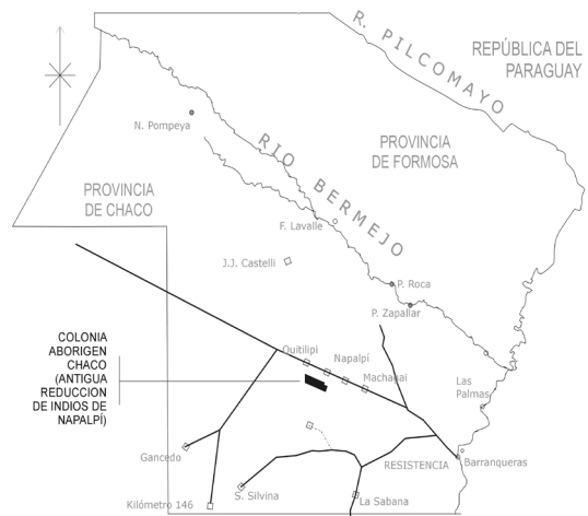
Mapa 1 Ubicación de la Reducción de Indios de Napalpí (Mapa realizado por el autor)

La Reducción de Indios de Napalpí fue fundada en el centro-este de la actual provincia del Chaco, con una extensión