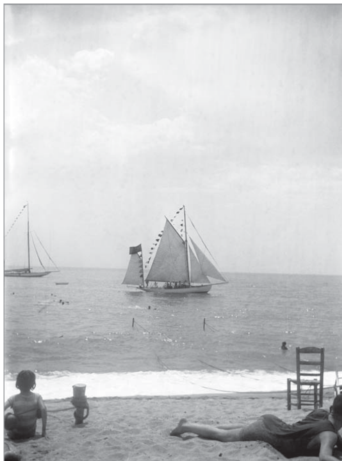
Platja de Caldes d'Estrac (Maria Codina, 1916)

En l'espai del primer pis es mostraren una selecció de pintures de Vila-Puig, un petit recorregut per la seva obra pictòrica,