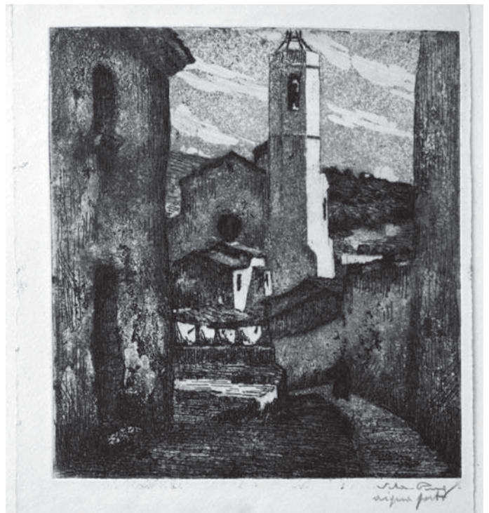
"Carrer de Caldes d'Estrac" (1920, Oli sobre cartró, 35 x 33 cm). A baix "Caldes d'Estrac" (1927, Aiguafort, 21'5 x 20 cm). Col·lecció Vila-Puig

9 x 12 i que ella mateixa revelava amb un equip propi. Malauradament, té un volum de producció escàs, que es podria fixar entre el 1915 i el 1922, any en què, per motius diversos, va abandonar la pràctica de la fotografia. Tanmateix, hem cregut interessant treure a la llum aquests documents valuosos.