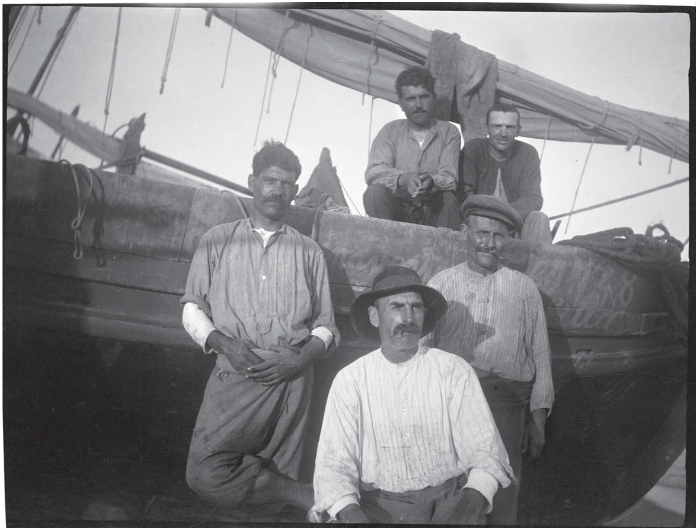
Pescadors (Maria codina, 1918)

Les fotografies de Caldes d'Estrac, que es mostraren per primera vegada, van ser realitzades entre el 1916 i el 1918 coincidint amb les seves estades a la població durant els mesos d'estiu.