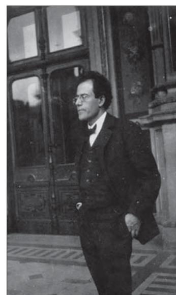
A l'esquerra Gustav i Alma (1903). A la dreta Gustav el 1907

Alma Mahler Gropius d'Almudena de Maetzú JPLibros. 2010 (330 pàgs.). ISBN: 978-84-937520-3-3