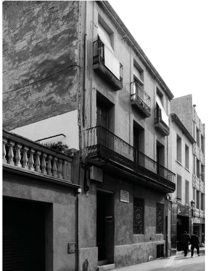
La casa Gorina

En el decurs d'aquests 500 anys, més o menys, a Matadepera el cognom es consolida com a nom de la família de l'antic mas Bassa. Tot i que a l'arbre troncal d'hereus de can Gorina de