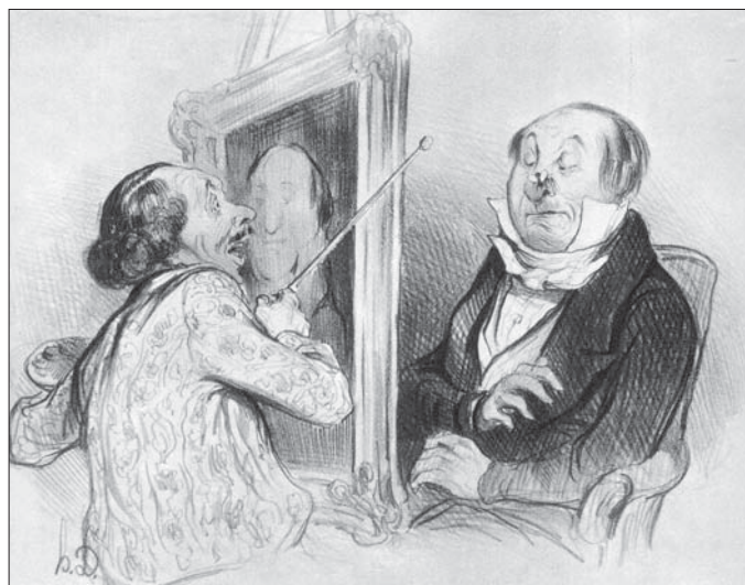
Figura 4. Honoré Daumier, 1838. - Si us plau, senyor! No mogueu les mans, que engegareu a rodar la sessió.