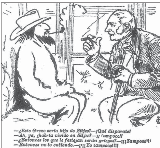
Figura 5. Apelles Mestres, 1898. -Aquest tal Greco seria fill de Sitges, oi? -No digui disbarats! -Ah, doncs, hi havia viscut? -Tampoc! -Llavors, són els grecs els qui ho han muntat? -Tampoc! -Doncs jo no ho entenc. -Jo tampoc!!!