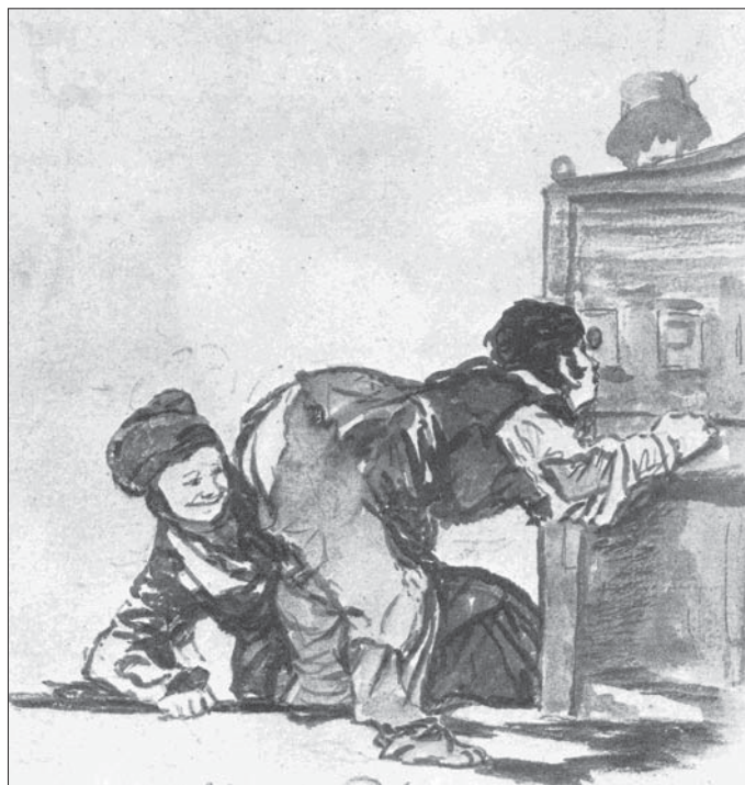
Figura 1. Francisco Goya, Tuti li mundi, Hispanic Society of America, New York , c. 1820. Un jove espellifat que ha pagat per contemplar l'atracció popular anomenada mundonuevo o tuti li mundi proporciona, de franc i sense adonar-se'n, un espectacle gratuït alternatiu a una noia. Jo el titularia Mirant pels forats.

Per produir el tipus d'humor gràfic a què em refereixo cal dominar la idea humorística (per exemple, un acudit) i la representació gràfica (habitualment, un dibuix). Es pot donar el cas que la idea i el dibuix siguin de creadors diferents però, curiosament, les dues tasques sovint recauen en la mateixa persona. Possiblement, aquest tipus d'obres està més a l'abast de l'artista plàstic que vol explicar una idea humorística que de l'humorista que hauria de dominar la representació gràfica, ja que per expressar-la amb èxit cal un cert domini del dibuix. De fet, el missatge està tan present en la imatge que de vegades pot prescindir del text. Però pot no ser així, com quan els escriptors catalans Pere Calders (Kalders) i Avel·lí Artís Gener (Tísner) van dirigir junts l'Esquella de la Torratxa del setembre de 1936 a l'octubre de 1937 i van encetar la millor etapa del setmanari amb un humor moderníssim que després de la guerra s'aniria estenent per tot el món.