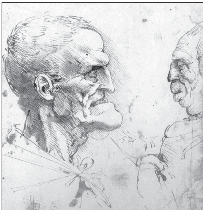
Figura 3. Leonardo de Vinci, ca 1487-1490. Dos homes discutien entre ells. Basant-se en l'autoritat de Pitàgores, l'un volia demostrar que havia estat en el món anteriorment. El segon no el deixava acabar de parlar. Llavors el primer li diu: - Aquesta és la prova que jo ja vaig estar aquí abans: recordo que tu eres un moliner. L'altre, picat, li dóna la raó tot dient: - És cert, ara recordo que tu eres l'ase que em portava la farina.

palès, com el disseny o l'humor gràfic. Veieu sinó el dibuix de la figura 6: el personatge de l'esquerra està fet amb quatre línies, i el de la dreta amb un parell de taques.