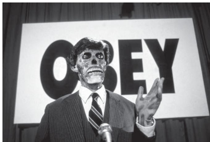
The Live (1988)

dels anys setanta, on un grup de malfactors (bastant llardosos) mantenen assetjada una solitària comissaria de policia. El film respira violència i tensió a parts iguals, amb un duel com a punt culminant. Una obra de culte avui oblidada i totalment reivindicable.