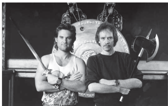
A dalt In the Mouth of Madness (1995), a baix John Carpenter i Kevin Russell durant el rodatge de Big Trouble in Little China (1986)

fantàstic de Roger Corman, i guanyà un Òscar amb The Resurrection of Broncho Billy (1970), un curtmetratge no fantàstic del qual va coescriure el guió i que li va servir per obrir-se portes i filmar el seu primer llargmetratge, Dark Star (1974), una pel·lícula simpàtica i prehistòrica de temàtica espacial i poc pressupost que encara té certa gràcia avui dia, potser per les seves connexions amb l'obra mestra de Kubrick 2001: A Space Odyssey (1968) (paraules majors...) o la posterior Alien (1979). Dark Star ja presenta moltes de les característiques que definiran el cinema de Carpenter: un duel èpic heretat del western clàssic, al qual el director hi afegeix elements fantàstics, un grup d'herois (o antiherois ) convertits en protagonistes, humor negre i elevades dosis de tensió i ritme que desemboquen en terror. La utilització d'aquests elements crearà escola.