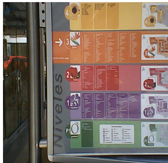
Figura 7. Centro Comercial Oviedo. Medellín