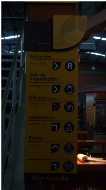
Figura 5. Directorio Inducerv. Sabaneta

Mientras más neutrales y simples sean las fuentes seleccionadas, más claro y directo llegará el mensaje simple (Saltz, 2009). Mientras más amplio sea el público objetivo de un lugar, más neutral deberá ser la tipografía de su sistema de orientación (ejemplo figura 4). Los aeropuertos o terminales de transporte, por ejemplo, deben cuidarse de recurrir a palabras de uso particular en un