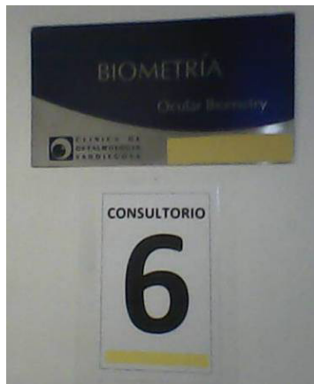
Figura 1. Clínica Oftalmológica San Diego. Medellín.

El uso de palabras en mensajes escritos visuales (no orales o locutados) debe ser cuidadoso porque la ausencia de un interlocutor que al expresarse gesticula su intención comunicativa obliga a que la palabra expuesta al público