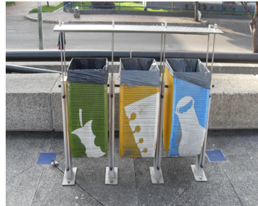
Figura 6. Maloka. Bogotá