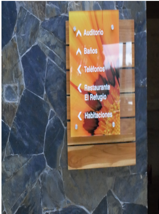
Figura 11. Parque Piedras Blancas de Comfenalco. Medellín.

donde serán implantados y la singularidad o pluralidad de sus visitantes y usuarios para establecer la manera en que habrá de diseñarse cada señal como elemento componente de un sistema de orientación. Cuando más específico sea el público al que sirve el sistema, más elaborada y conceptual podrá ser la respuesta gráfica en las piezas, y cuando más general sea el público, más simple, neutral y sintética deberá ser la información presentada.