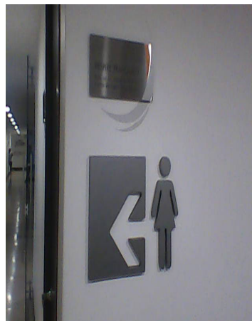
Figura 2. Clínica Oftalmológica de Antioquia. Medellín.