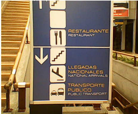
Figura 4. Aeropuerto José María Córdova. Rionegro

la selección tipográfica debe procurar la lectura instantánea y rápida de mensajes cortos.