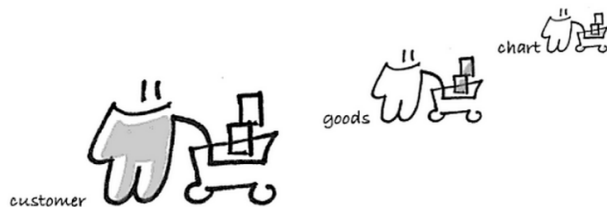
Figura 8. Comprador – Bienes – Carrito de compras. Gras (2011)

una función precisa y no debe considerarse como un simple elemento decorativo o excusa para llenar un espacio dentro de una señal. Debe haber correspondencia directa entre el significado del pictograma con el texto (cuando lo hay) y el espacio al que obedece su representación, de manera que la función pragmática cumpla positivamente su objetivo: la interpretación adecuada por parte de los usuarios del lugar.