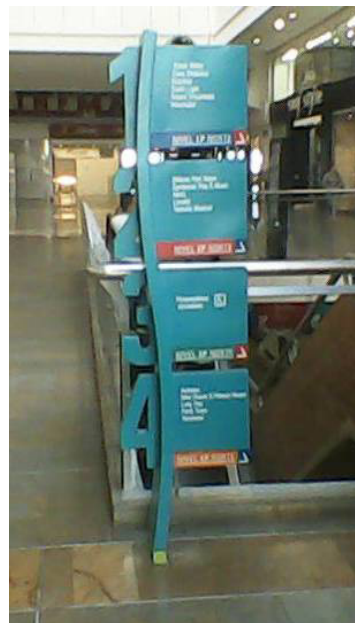
Figura 3. Subdirectorío parque Comercial El tesoro. Medellín.

La escuela de Ulm y la Bauhaus exploran el recurso tipográfico para darle cualidades pictográficas a la mera letra; cada letra es una silueta en sí misma y puede usarse como un recurso muy versátil en el diseño (Saltz, 2009), de manera que se dispone dinámica y desligada de su uso lingüístico tradicional (ejemplo figura 2); es ahora un elemento visual que comunica más allá del fonema mismo, su forma, su color y disposición (diagramación y composición) implican nuevos recursos