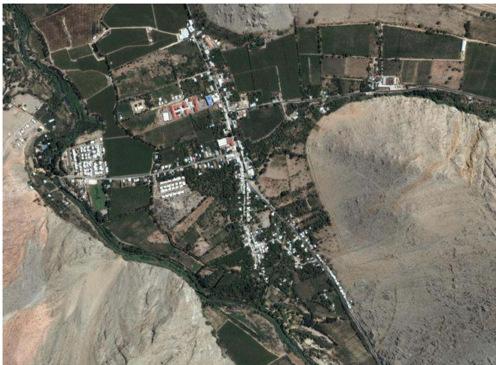
Figura 1. La fotografía muestra una imagen aérea de Paihuano en el año 2006, donde se puede apreciar el trazado original (Norte –Sur) del pueblo y los nuevos loteos sociales (ubicados en la izquierda de la imagen).

Se plantea comparar los nuevos loteos con la traza original en su gasto o consumo energético promedio por vivienda, y analizando variables como la materialidad, forma y orientación de la envolvente para ver como se relacionan con el consumo.