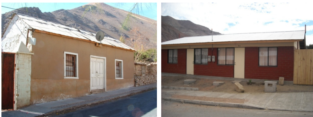
Figura 2. Imágenes de una vivienda tradicional y una vivienda de loteo SERVIU.

Por último tenemos que la localidad de Paihuano está dentro de la zona térmica 3, según la clasificación del MINVU 9 , lo que permite evaluar una zona semidesértica que necesita de estrategias para su refrigeración y calefacción y poder verificar qué variables están ayudando a disminuir al mínimo la demanda de energía y optimar al máximo las ganancias internas y externas, ambos planteados como objetivos por el MINVU en las últimas modificaciones a la Ordenanza General de Urbanismo y Construcciones