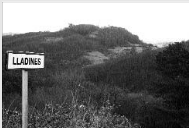
VISTA DE SANTOLAYA DESDE LLADINES, CUYO NÚCLEO ESTABA SITUADO MÁS O MENOS POR ENCIMA DEL INDICADOR.

Poco a poco Santolaya se fue despoblando y, ahora, apenas quedan visibles unos muros de la última casa habitada allá por los comienzos de los años 70 del pasado siglo. Hoy es un bosque lleno de maleza, en el que, cuando sopla la brisa, se oye el suave murmullo de las gentes que habitaron en el pasado. Para que no se pierda su memoria escribimos esta pequeña historia.