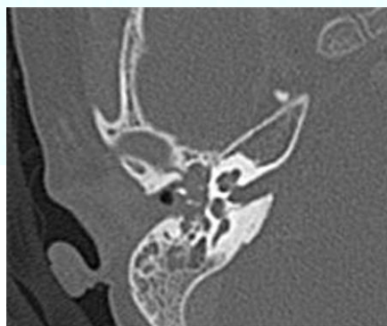
Figura 1. TC de peñasco con contraste: ocupación mastoidea compatible con otomastoiditis y petrositis derecha.

Escolar de 4 años de edad que ingresa por cuadro de fiebre de 4 días de evolución, otalgia, fotopsias, episodios intermitentes de cefalea frontal y postración con tendencia a la somnolencia. En la exploración se aprecia el ojo derecho en aducción sin ptosis ni alteraciones pupilares; la otoscopia revela un abombamiento de la membrana timpánica con otorrea en oído derecho. Se inicia tratamiento con cefotaxima. En la TC se muestran hallazgos compatibles con otomastoiditis (Figura 1). La Angio-RM revela petrositis derecha con trombosis de seno cavernoso derecho, arteritis de porción intracraneal de arteria carótida interna derecha y trombosis parcial de tercio inferior de seno sigmoide y porción inicial de vena yugular interna derecha (Figura 2). Se añade vancomicina, metronidazol y dexametasona al tratamiento previo, además de tratamiento anticoagulante con Enoxaparina. Permanece 31 días ingresado y es dado de alta asintomático con tratamiento domiciliario y control clínico-radiológico posterior.