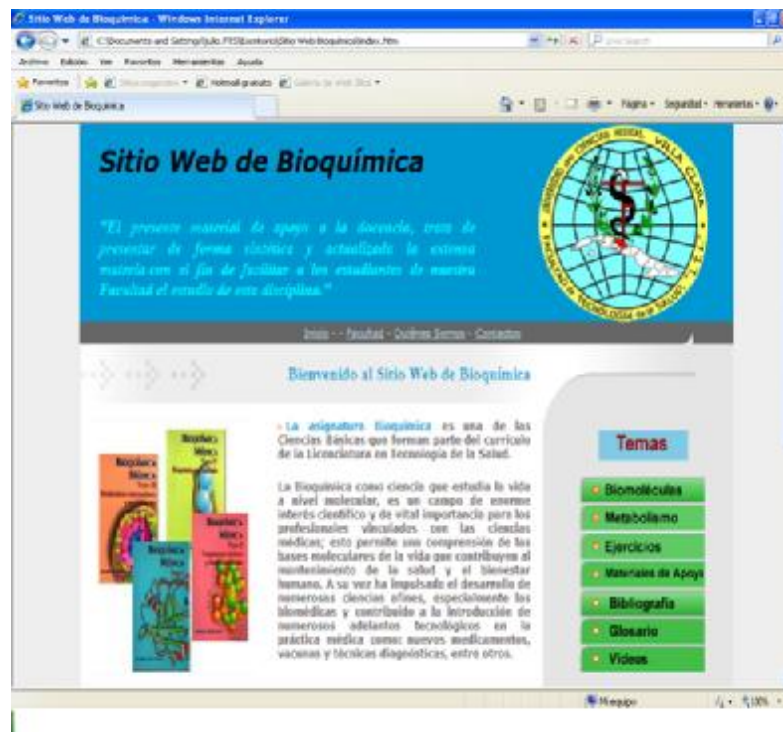
Fig 2. Página Principal.

La página principal del sitio está dividida en tres paneles, uno superior, que ocupa todo el ancho de la ventana y a continuación dos paneles: uno derecho y otro en el centro. La figura 1 muestra el formato de la página principal sobre la cual fueron montadas las demás del sitio