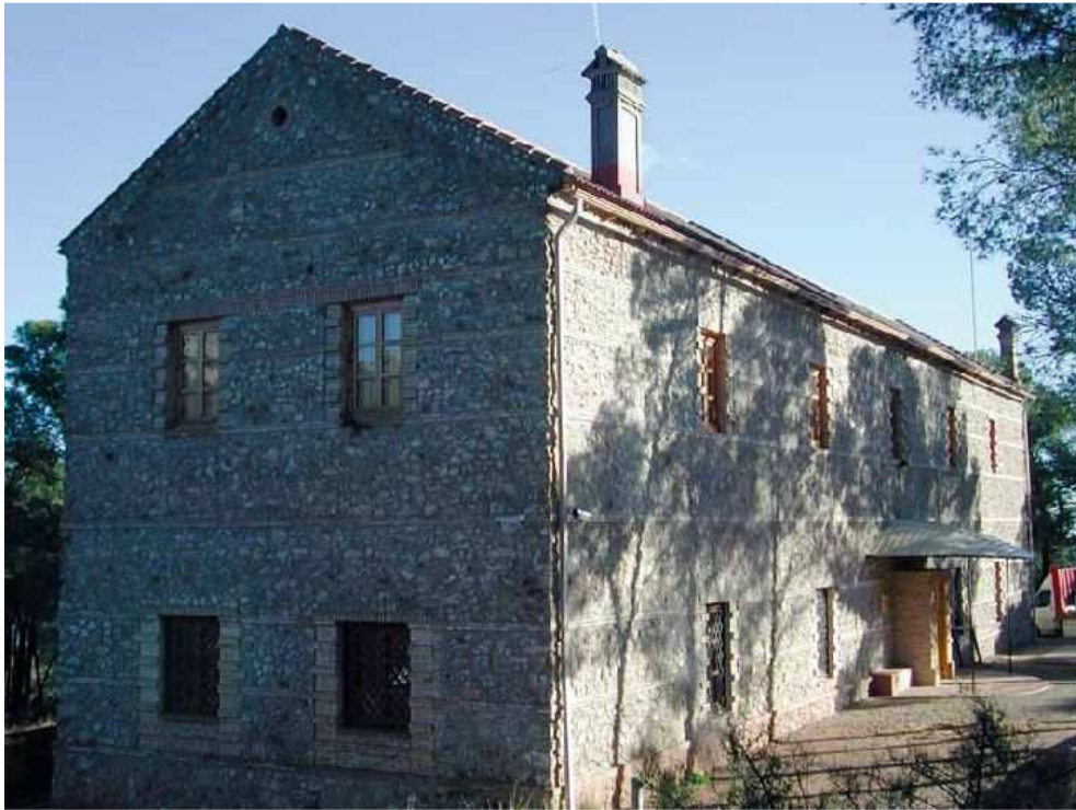
Foto nº 2: Centro de Visitantes Ricardo Codornú (Parque Regional de Sierra Espuña)