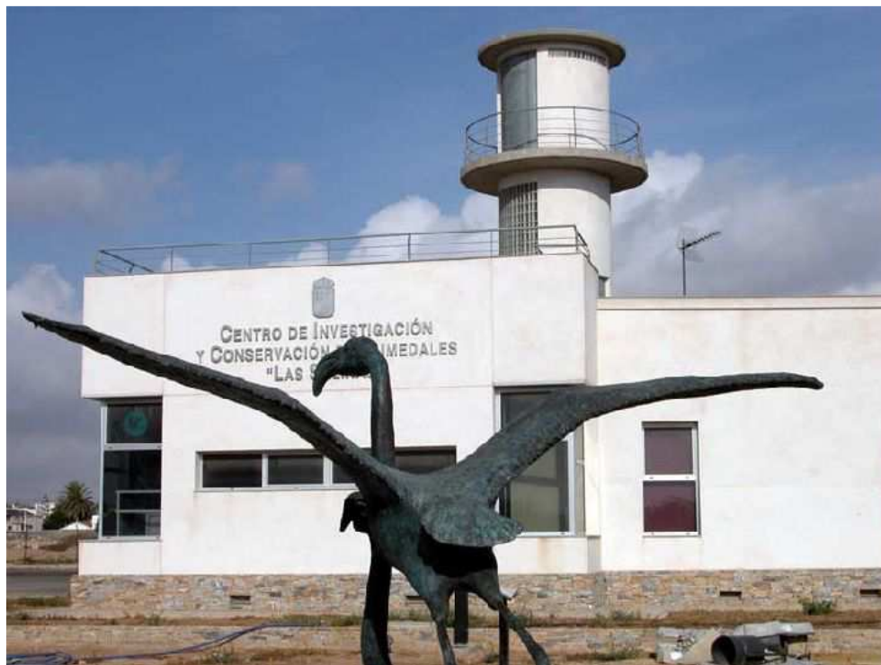
Foto nº1: Centro de Investigación y Conservación de Humedales (Salinas y Arenales de San Pedro del Pinatar)