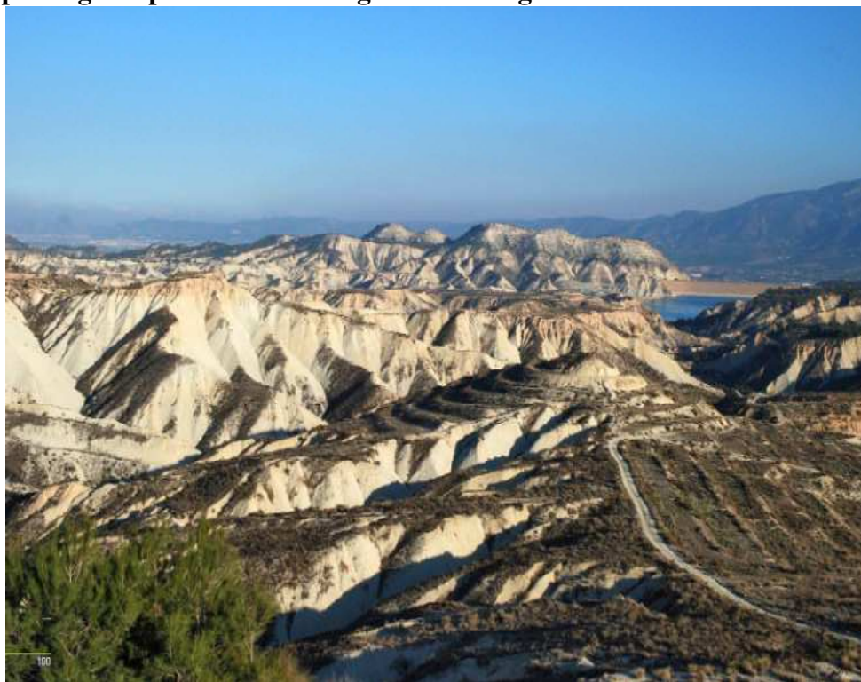
Foto nº 7: Paisaje natural Barrancos de Gebas. Paisaje protegido por su interés geomorfológico