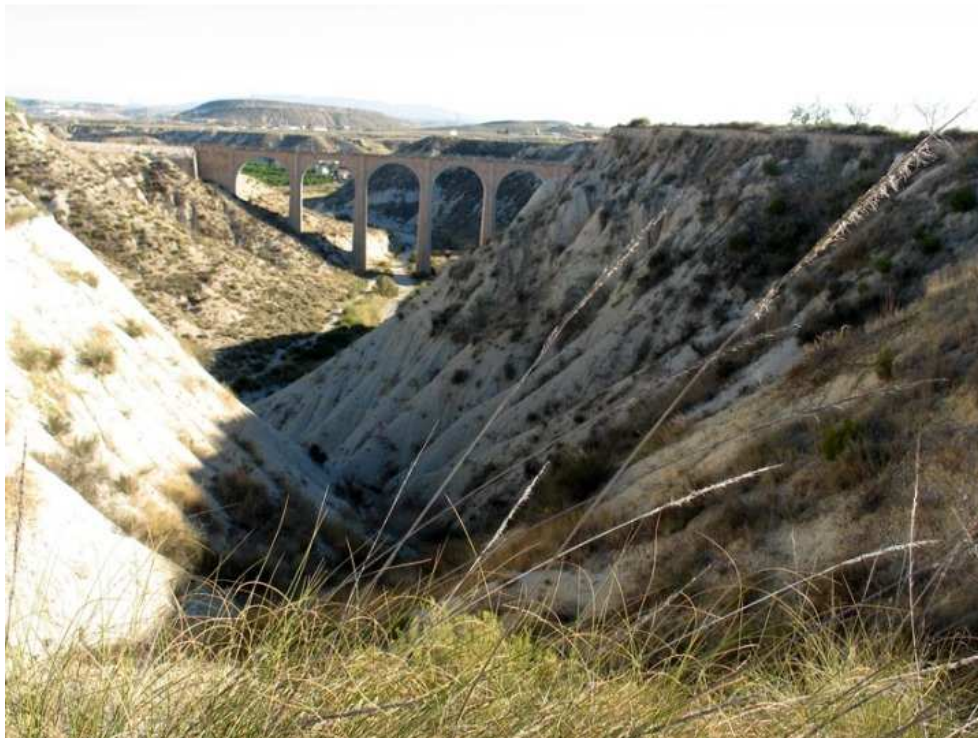
Foto nº 8: Barrancos que desembocan en la rambla de Perea con el viaducto al fondo.