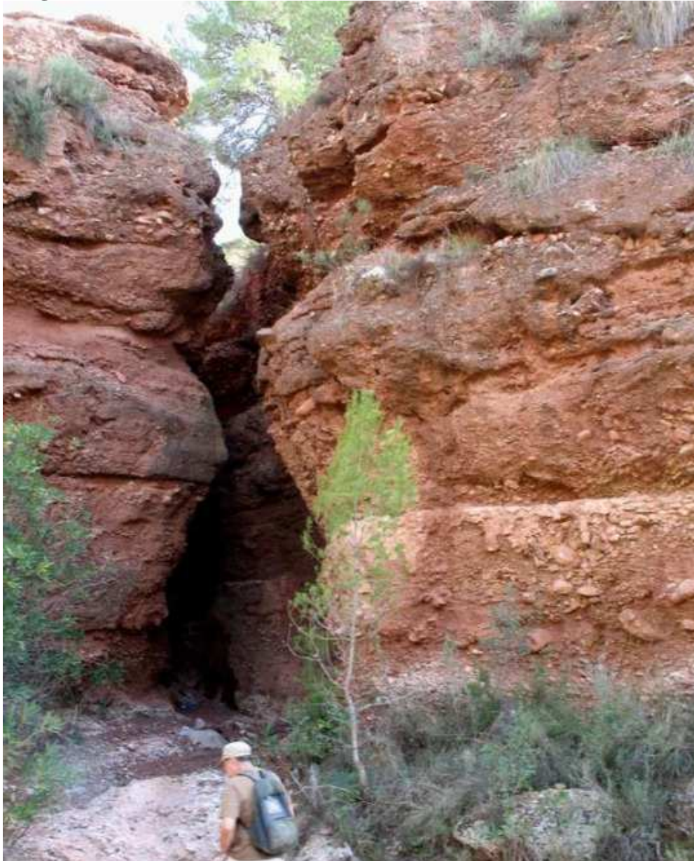
Foto nº 10: Estrecho de Agualeja: ejemplo de erosión en conglomerados deltaicos