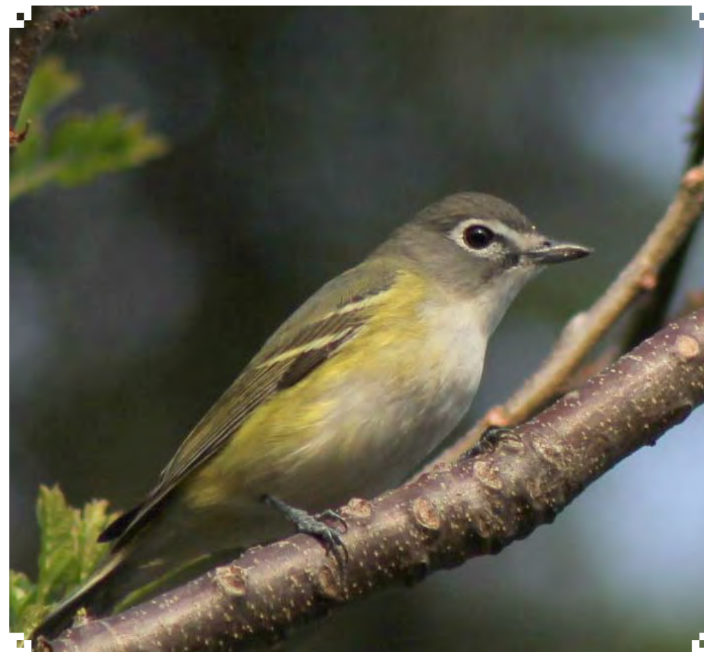
Vireo solitarius .

Stiles, F. G. y A. F. Skutch. 2007. A guide to the birds of Costa Rica . Ithaca, New York: Cornell University Press.