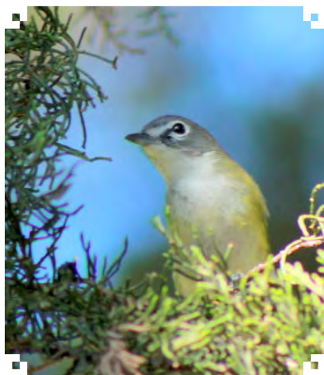
Vireo solitarius .

Buscaba insectos con vuelos cortos, lentos y pesados entre las ramas. También escudriñaba en las hojas arrolladas. Realizaba también pequeñas persecuciones detrás de polillas. Frecuentemente realizaba un comportamiento de percharse, quedarse inmóvil por dos segundos y continuar su avance entre las ramas. Consumía