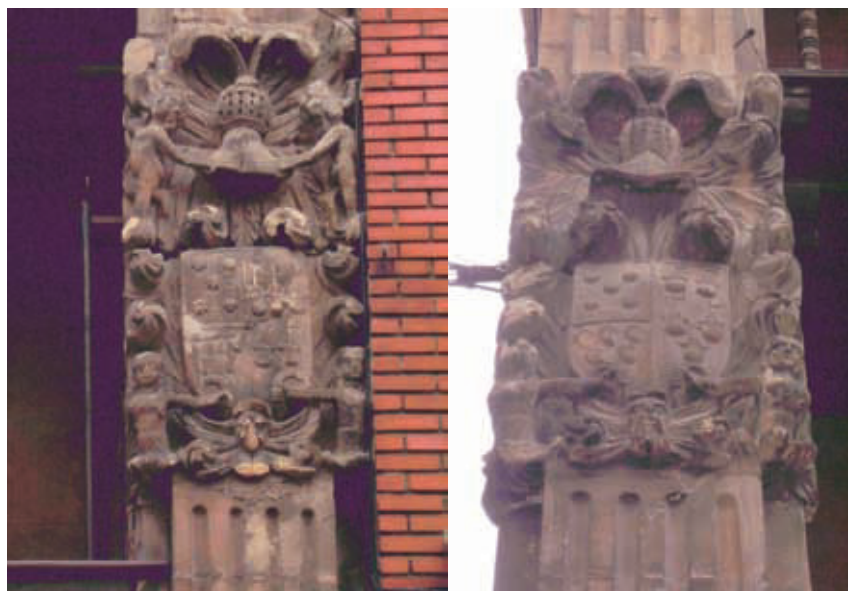
Figura 11. Escudos de Calderón con las panelas de Guevara en el segundo cuartel (Torrelavega).