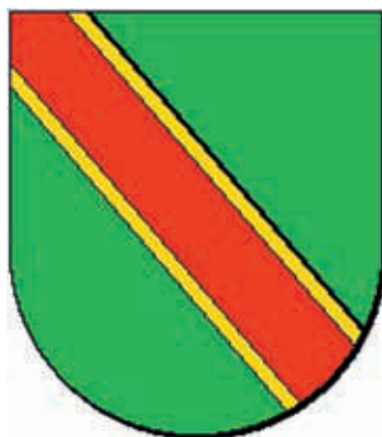
Tipo 1. En campo de sinople, banda de oro y cotiza de gules

Existe una fabulación sobre su origen, atribuyéndose la banda a las armas del Cid, puesto que dicen usó en campo de sinople banda de gules.