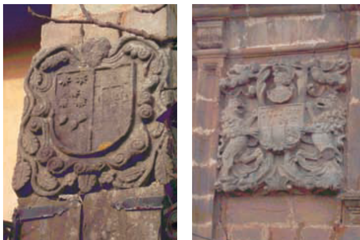
Figura 12. Escudo con estrellas y panelas sin identificar, Casar de Periedo (izquierda). Escudo de Rubín de Celis, Casar de Periedo (derecha).

Dada la poca frecuencia de panelas en esta zona hemos analizado la presencia de éstas en los escudos de las Asturias de Santillana. Destaca la presencia de panelas en dos escudos más de Periedo (figura 12). Uno de ellos presenta en un cuartel el escudo de los Gómez derivados de los Mendoza. El otro presenta las estrellas de Rojas y las panelas de Guevara, si bien en número de tres. Intuimos que puede deberse a un problema del picapedrero al no haber cabido dos panelas más en el espacio que resta. Curiosamente siempre que vemos panelas en las Asturias de Santillana lo hacemos asociadas a estrellas y muy frecuentemente a lises. En La Franca encontramos un escudo cuartelado de Vega y Noriega que presenta tres lises y cinco estrellas en su exterior (hemos localizado la casa pero no pudimos acceder). Una de las posibilidades que hay que barajar es que representa al linaje Rubín de Celis, originario de Peñamellera, como los Noriega y los Mier. A escasos cinco metros del escudo de Periedo con panelas y estrellas, nos encontramos una casona con el escudo de los Rubín de Celis. El uso de estrellas es muy frecuente en la montaña pero es excepcional que sea la única figura del escudo.