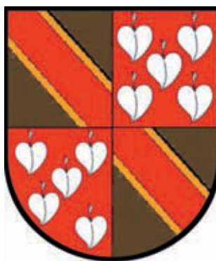
Escudo cuartelado. 1 y 3 en campo de sinople banda de oro con cotiza de gules, 2 y 4 en campo de gules, cinco panelas de plata. Presente en el nobiliario de los reynos hispanos