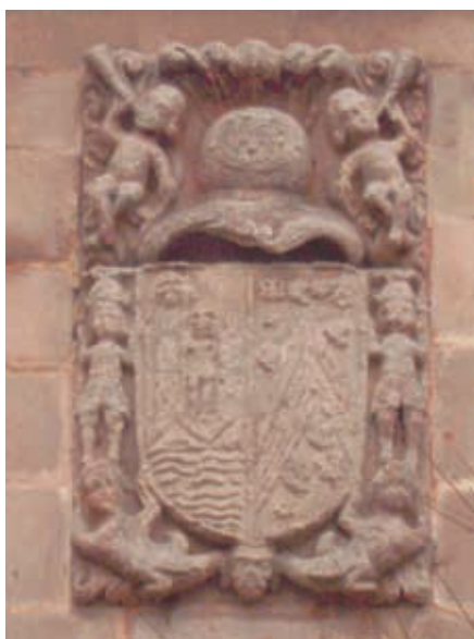
Figura 13. Escudo de Rivero y Gutiérrez, Mazcuerras.

En Mazcuerras está el escudo de Juana Gutiérrez del Alcalde, mujer de Silvestre del Rivero, que casaron en 1660. El escudo partido con las armas de Rivero y las de Gutiérrez que son: Tres contrabandas y tres bandas formando un chevrón o cabria. En el jefe tres lises y diseminados por el campo cinco panelas y cinco estrellas (figura 13).