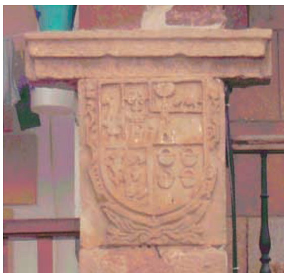
Figura 16. Escudo en la Abadilla de Cayón (la pieza ha permanecido en el pueblo, si bien ha sido reutilizada).

En cuanto a otros escudos con panelas también podemos mencionar que se encuentran en el escudo de los Saro (figura 16), según consta en la certificación de armas de Lorenzo Díaz de Lamadrid de Argomilla, si bien es obvio que es una invención del rey de armas Juan Alonso Guerra en 1740: en pal 1: en campo de oro león de gules coronado y rampante y 2: en campo de gules cinco panelas de plata en souter.