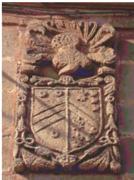
Figura 14. Escudo de Gutiérrez (Rudagüera).

En Rudagüera (municipio de Alfoz de Lloredo) nos encontramos quizás el escudo más completo de Gutiérrez. (figura 14) Lleva la inscripción Gutiérrez y es un escudo partido: En el primer cuartel tres contrabandas, en jefe dos estrellas y en punta una. En el segundo cuartel dos bandas, en jefe tres panelas y una lis y en punta dos lises y dos panelas.