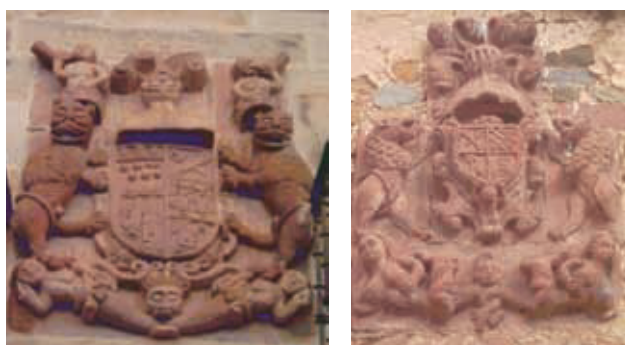
Figura 8. Escudos de Gómez en Renedo de Cabuérniga: Izquierda: Armas de Rubín, Gómez, Cossio y Terán. Derecha: Armas de Gómez y Terán.

En Cabezón de la Sal encontramos más escudos con las armas de Gómez, estos dos en el barrio de la Pesa, ya no entroncando con linajes poderosos y banda sin cotiza añadida (figura 9).