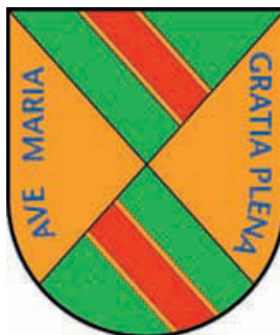
Tipo 3. Cuartelado en Souter: 1 y 3: en campo de sinople, banda de oro con cotiza de gules, 2 y 4: en campo de oro el lema en letras de azur «AVE MARIA GRATIA PLENA»

Posteriormente, al entroncar Diego Hurtado de Mendoza en 1387 con Leonor de la Vega (fallecida en 1432) usaron sus descendientes un cuartelado en souter, mostrando una típica influencia de la corona de Aragón, introduciendo así una nueva forma de combinación de las armerías en Cantabria.