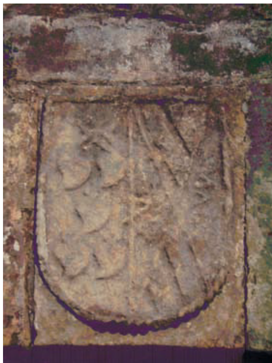
Figura 5. Escudo de Mendoza-Vega en Periedo

En La Franca (Asturias) existe un escudo de Vega que tiene en su exterior cinco estrellas y tres lises, curiosamente los elementos que hay en el campo del escudo de los Gutiérrez que mencionaremos posteriormente. El escudo es un cuartelado de 1 y 3: Cuartelado en souter con las armas de Mendoza y el AVE MARIA de la Vega y 2 y 4 águila explayada. Los cuarteles 2 y 4 indican un entronque con el linaje Noriega.