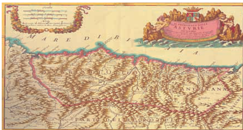
Figura 1. Mapa de 1696 de las Asturias de Santillana

bria y el extremo más occidental de la actual Asturias. El valle de Peñamellera y sus relaciones con las Asturias de Santillana (fig. 1) han sido estudiados muy profundamente recientemente (3).