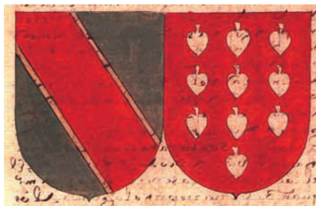
Figura 4. Escudos de Mendoza en el Nobiliario de casas y linajes de 1570

Existe una fabulación sobre su origen, atribuyéndose la banda a las armas del Cid, puesto que dicen usó en campo de sinople banda de gules.