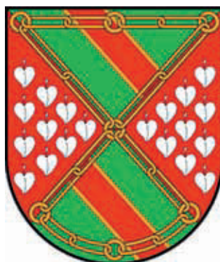
Tipo 4. Cuartelado en souter: 1 y 3: en campo de sinople banda de oro con cotiza de gules. Bordura con las cadenas de Navarra, 2 y 4: en campo de gules diez panelas de plata

En Sevilla está presente el escudo de los Mendoza junto al de los Luna siendo descrito en varios libros de armerías clásicos. Las armas de Mendoza están descritas en los siguientes libros de armerías: