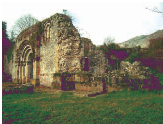
Figura 3. Iglesia de San Pedro de Plecín. Alles. Peñamellera

El uso de las panelas de los Guevara por los Mier pudo haber sido por descendencia o por apropiación. Trespalcios alude a dos linajes locales también descendientes de este Conde Don Vela, aunque en ningún momento alude al uso de una heráldica común, lo que apoya más su versión del origen común de estas familias. Para Mier describe un escudo cuartelado: 1: En campo de plata una cruz, 2: En campo azul una espada rodeada de cinco estrellas, 3: En campo de plata cinco coronas de gules, 4: En campo de plata cinco flores de lis. Se basa en una descripción de Juan Caso de su desaparecido libro «Tratado de las casas y apellidos del principado de Asturias y montaña de Santander» de 1717. Es lógico pensar que equivocó las panelas con coronas puesto que es un mueble infrecuente en la zona. Para ser precisos, Caso habla de «cinco coronas de sangre en plata» y Trespalcios corrige diciendo «coronas de sangre en campo de plata». Hay más elementos que apoyan la teoría de que estas panelas de los Guevara son las que usan los Mier. Trespalcios habla de que los descendientes de Vela fueron los Mier, los Trespalcios y los Colosía. Colosía usó las mismas armas que Mier. En Merodio se puede ver 1: En campo de oro cruz floreteada de gules, 2: de