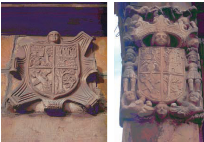
Figura 9. Escudos de Gómez (tercer cuartel), Cabezón de la Sal.

En Cabezón de la Sal encontramos más escudos con las armas de Gómez, estos dos en el barrio de la Pesa, ya no entroncando con linajes poderosos y banda sin cotiza añadida (figura 9).