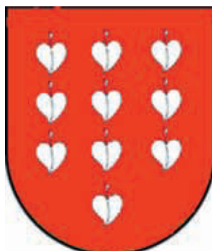
Tipo 2. En campo de gules 10 panelas de plata

Posteriormente, al entroncar Diego Hurtado de Mendoza en 1387 con Leonor de la Vega (fallecida en 1432) usaron sus descendientes un cuartelado en souter, mostrando una típica influencia de la corona de Aragón, introduciendo así una nueva forma de combinación de las armerías en Cantabria.