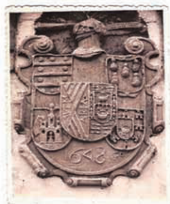
Figura 6. Escudo de Jove en Gijón

En la heráldica oficial del municipio de Torrelavega persiste actualmente el uso de dos bandas en el cuartelado en souter en vez de la única la banda típica de los Mendoza (figura 7).