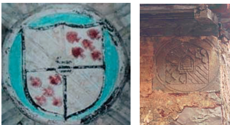
Figura 2. Escudos de Guevara. San Vicente de la Barquera (izquierda) Escudo invertido en una cuadra de Treceño (derecha)

un escudete con las armas de Ceballos. En Comillas encontramos un escudo de los Guevara de Valdáliga. Parece ser un cuartelado de Ceballos y Guevara. En el primer cuartel vemos un cuartelado que tiene, en 1 y 4 tres fajas y bordura de jaqueles, y en 2 y 3 tres bandas y en los cantones tres panelas. El escudo original de los Guevara en las Asturias de Santillana se puede ver en la iglesia parroquial de San Vicente De la Barquera o en Treceño (figura 2). Este de Treceño está actualmente invertido y reutilizado como pilar de una esquina de una cuadra.