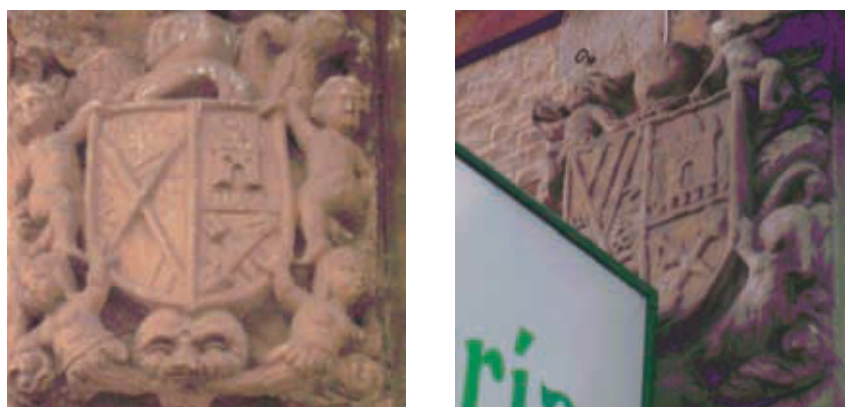
Figura 10. Escudos de Vega, Guerra y Gómez en Cabezón de la Sal.

curioso ejemplo de usos heráldicos en los que la persistencia de la forma se ha superpuesto al fondo, de tal manera que dos linajes con un uso heráldico basado en la banda de los Mendoza seguramente desconocen su origen y los combinan sin conocer que remotamente tuvieron una procedencia común. En el escudo de la izquierda están escritos los nombres Vega, Cossio, Torre y representados los Vega, Torre y Gómez. En el escudo de la derecha tenemos un lamentable ejemplo de la superposición de un cartel publicitario sobre un verdadero bien de interés cultural. Ciñéndonos en el escudo comprobamos como la banda de los Mendoza del escudo en frange de los Vega se ha convertido en tres bandas cuestión que persiste incluso en la heráldica oficial del municipio de Torrelavega en determinados escudos. Los dos escudos se encuentran en una hilera de casas separados por apenas 20 metros, muy cercanos a la iglesia parroquial de Cabezón.