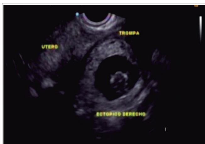
Figura 1. Ecografía abdominal de la paciente donde se visualiza embarazo ectópico intersticial.

una presión arterial de 110/60 mmHg y frecuencia cardíaca de 90 por minuto.