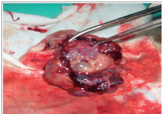
Figura 3. Corte sagital e identificación, donde se visualiza producto de 11 semanas y saco gestacional en pieza quirúrgica.

Ingresa al servicio con los diagnósticos de embarazo de 11 semanas por fecha de última menstruación, hemorragia de la primera mitad del embarazo y probable embarazo ectópico.