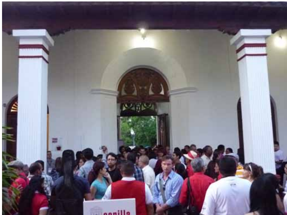
Re-apertura del museo