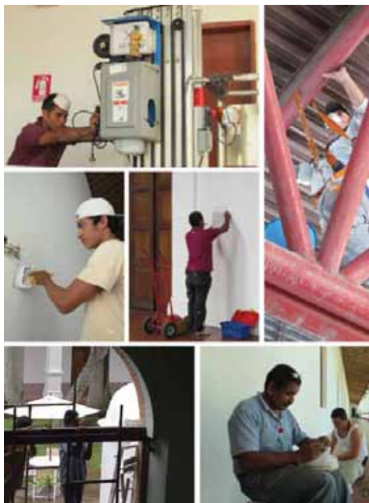
Proceso de restauración del Museo de Barquisimeto

El Museo de Barquisimeto se encuentra ubicado en la carrera 15, entre calles 25 y 26 de la ciudad de Barquisimeto, estado Lara. La antigua edificación de valor histórico y arquitectónico que le sirve de sede albergó en otras épocas distintas instituciones hospitalarias como el Hospital San Lázaro (1579); el Hospital de La Caridad (1877); y el Hospital “Antonio María Pineda” (1939), hasta que finalmente sus espacios fueron destinados al funcionamiento del Museo en 1982. ■