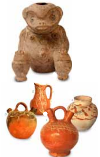
Colección Museo de Barquisimeto