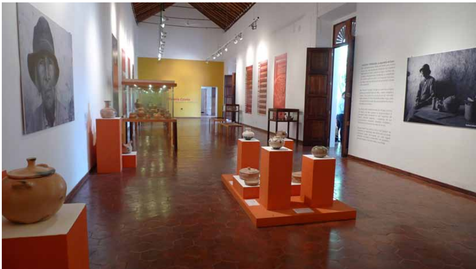
Salas expositivas del Museo de Barquisimeto