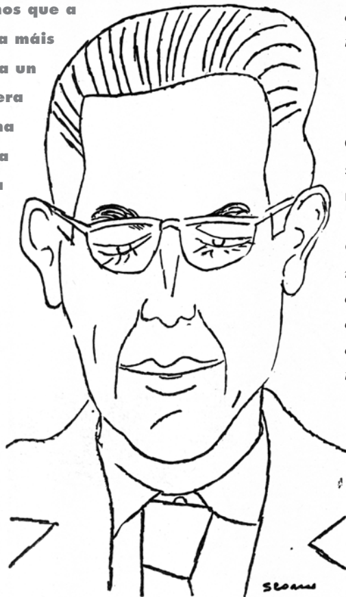
Ramón Piñeiro (Letras Galegas 2009) visto por Seoane

Nós estimabamos que a primeira medida, a máis importante, para un galego galeguista era loitar contra unha situación política que negaba toda posibilidade de que Galicia recuperara a súa personalidade e recuperara a súa nacionalidade, a súa cultura.