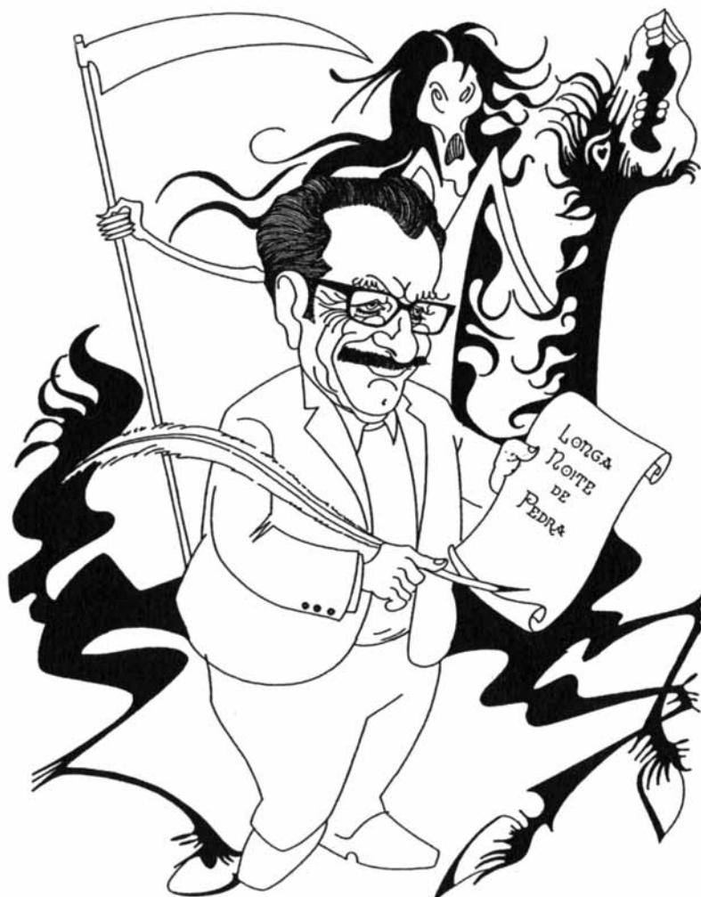
Celso Emilio Ferreiro (Letras Galegas 1999) visto por Siro.

O que é o Día das Letras Galegas [...] é a exaltación da literatura e das letras galegas, que en certa maneira, e no seu trasfondo, é a conmemoración e a exaltación da nosa lingua. [...] é definitivamente, a exaltación da nacionalidade galega.