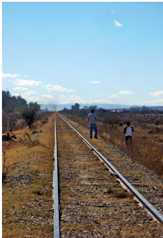
Malaga México. Ferrocarril Durango Coahuila cerca de Málaga

remite a una página de internet, de la que hemos reproducido una foto de la línea de tren más cercana. Algún dato más nos aporta el señor Sharp, del Colegio Americano de Durango, que en dos ocasiones ha estado en las proximidades de este pueblo, en concreto en un pastizal vecino, también conocido como Málaga, famoso por la diversidad de sus aves. El portavoz del Colegio Americano nos informa de que la Málaga mexicana está formada por posibles ejidatarios, nombre que en México hace referencia a los campesinos que recibieron tierras expropiadas a grandes hacendados. Estos ejidatarios no pueden vender las tierras pero sí dejárselas a sus descendientes.