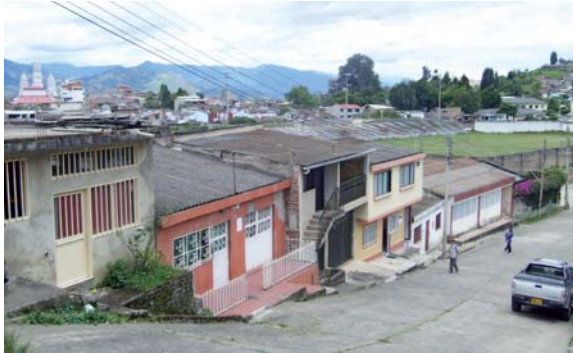
Málaga Colombia. Vista de una calle