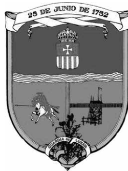
Figura 2. Escudo heráldico de la ciudad de Mercedes