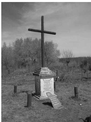
Figura 3. Imagen del monumento “Cruz de Palo” sito en Mercedes

Viloría et al. (2009) dan cuenta del malón indígena que se considera el hecho histórico que inspiró la construcción de la “Cruz de Palo”. Señalan que