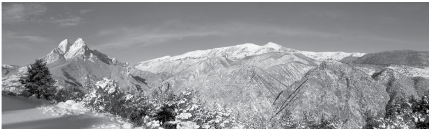
Serra del Cadí

des d'arreu on s'observa. Cadí, en llengua àrab, vol dir cabdill, home que mana. I precisament a partir d'aquest nom s'explica una història mil·lenària.