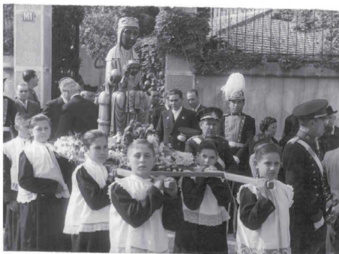
La Moreneta de Montserrat

Des del castell, atemorits, van començar a disparar amb les sagetes contra tot aquell que s'apropava més del que ells volien. Però malgrat optar per aquest sistema de defensa, la gran pregunta era com desfer-se d'aquell encanteri. No tenien mitjans per alliberar-se d'aquell mal. La gent va començar a resar: les dones, els vells, els nens, els homes. Molts dies van resar i resar, fins que la nit de Sant Silvestre, l'últim dia de l'any, i mentre el poble resava, es va tornar a sentir un fort retronir de la muntanya. Tot tremolava de nou: trons, llampecs, terrabastalls i