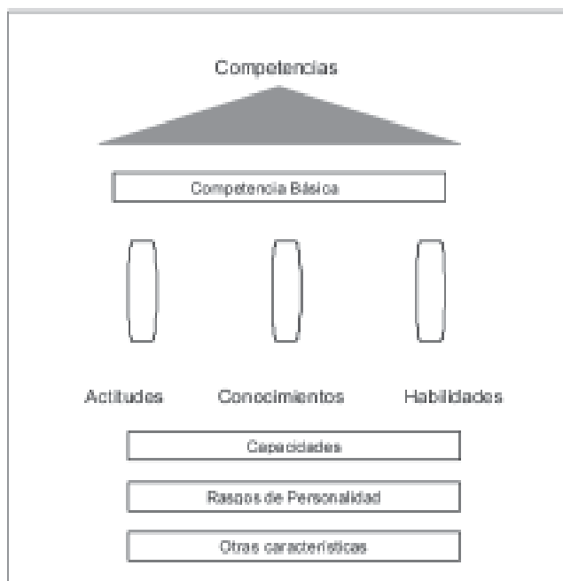
Figura 2 : Modelo de Competencias propuesto por Roe (2003)